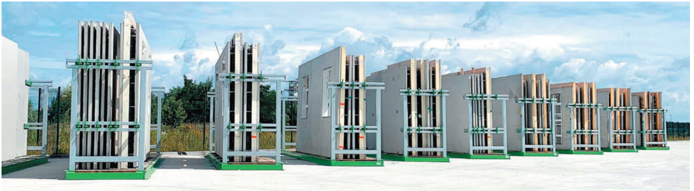
Mój Dom liefert Betonfertigteile, bei denen die Aussparungen bereits implementiert sind.

Zusätzlich fungiert die speziell für die Betonfertigteilindustrie entwickelte e pbos -Lösung als übergeordnetes ERP-System und ermöglicht die Planung und Steuerung aller Geschäfts- und Produktionsprozesse. Vom Vertrieb, der Kalkulation, dem Projektmanagement, dem Engineering, der Produktions- und Montageplanung bis hin zur Logistik und Materialwirtschaft werden alle Anwendungen über dieses zentrale System nahtlos verbunden und verwaltet.