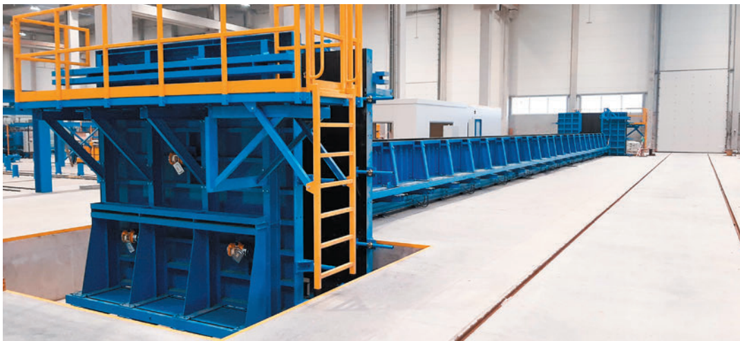
Formen für Stützen und Fundamentsockel

WPBM „Mój Dom“ Prefabrykacja S.A. Źródła/Polen eröffnete das modernste Umlaufwerk zur Herstellung von Betonfertigteilen in ganz Polen - ausgestattet mit drei separaten Produktionslinien auf verschiedenen Ebenen für unterschiedliche Elemente: Bodenplatten, Wände (massiv, isoliert, Verbund- und Schichtbauweise) und andere Elemente, z. B. Treppen, Balkone, Stützen, Träger. Die Anlage kann über eine Million Quadratmeter pro Jahr produzieren, mit einer Tagesleistung von 3.000 m 2 filigranen Elementen, 1.000 m 2 Wänden und 50 m 3 andere Betonfertigteilelemente.