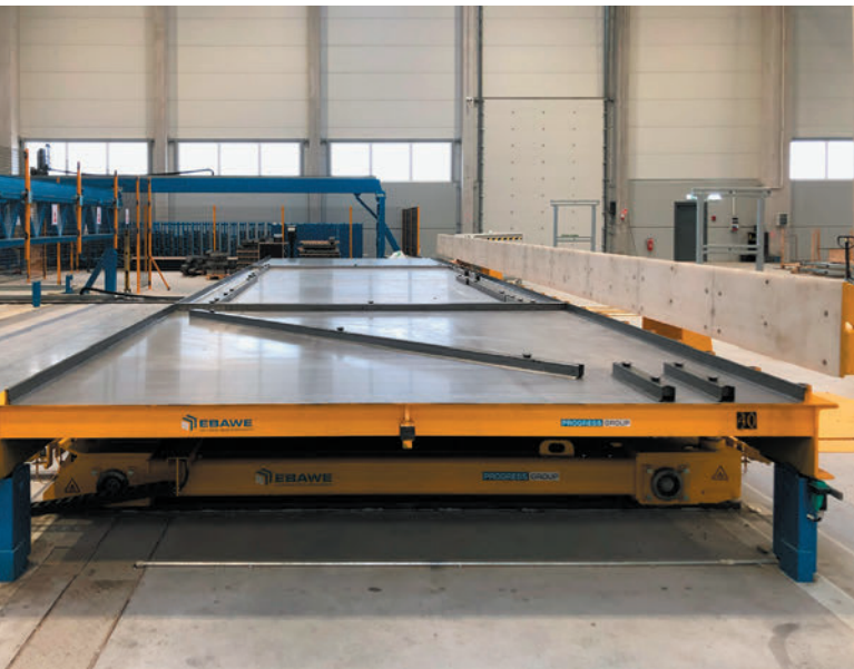
Die Schalungselemente werden nach Plan genau dort platziert, wo sie benötigt werden – vollautomatisch und schnell.

Nach der Reinigung wird das neue Betonfertigteil aufgebaut. Der Unterschied zum Rest des automatisierten Systems besteht darin, dass der nächste Schritt manuell erfolgt, d. h. die Matten, Körbe usw. werden manuell eingefügt. Aus diesem Grund steht die M-System Mattenschweißanlage für sich allein und ist nicht direkt mit der Umlaufanlage verbunden, die fast vollständig automatisiert ist. Die Mattenschweißanlage ist noch auf eine andere Weise besonders: Mój Dom kann Matten herstellen, die flachen Matten abtransportieren oder sie bei Bedarf zur Biegeanlage transportieren und dort zu Körben biegen. In dieser Kombination ist dies eine sehr seltene Lösung, die von Progress geliefert wird. Neben flachen Matten und Körben kann die Anlage auch gebogene Matten (z. B. für Massivwände) herstellen. Der nahegelegene Pluristar Bügelbiegeautomat mit zusätzlichem Auslauf arbeitet ebenfalls autark. Seine Auslastung hängt stark davon ab, ob zusätzliche Bewehrungen in der Umlaufanlage oder auf der Baustelle benötigt werden. Wenn ja, werden diese hier hergestellt. Mój Dom kann entweder mit dem Auslauf arbeiten, wenn größere Produkte benötigt werden, oder ohne Auslauf wie ein Bügelbiegeautomat in der Grundausstattung. Alle Produkte können mit beliebigen Aussparungen für Türen und Fenster versehen werden und bieten somit ein Höchstmaß an Flexibilität in der Produktion.