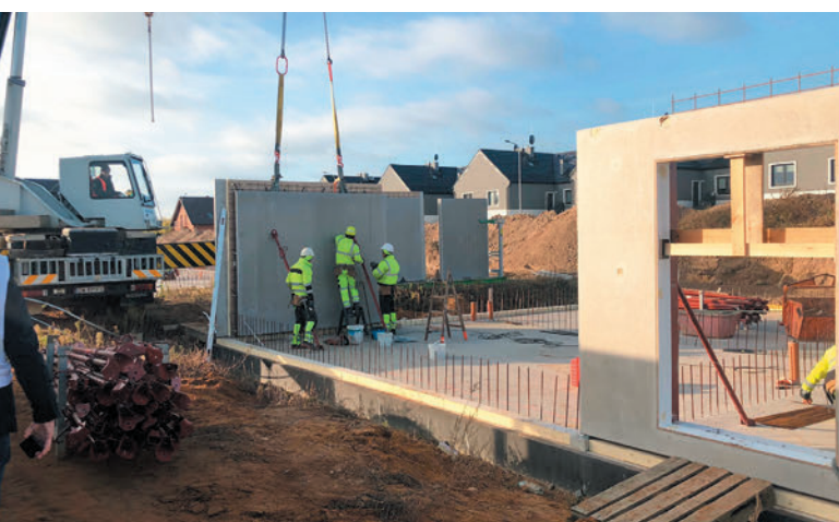
Die schnelle Montage auf der Baustelle erfolgt durch ein gut geschultes und professionelles Team, das den Umgang mit den verschiedenen Betonfertigteilen beherrscht.