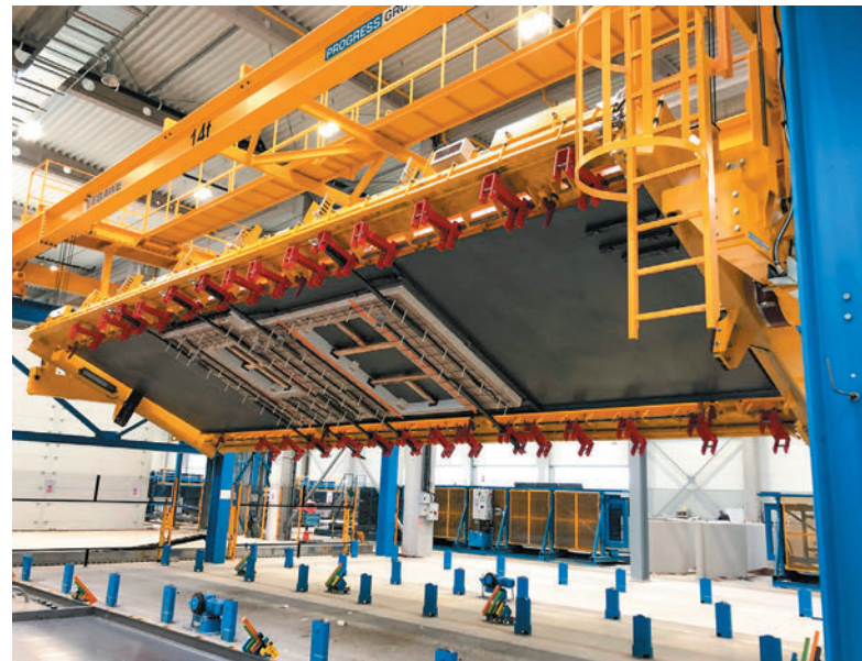
Die Wendeeinrichtung von Ebawe Anlagentechnik sind vollautomatisch und arbeiten millimetergenau.

Auch in der Deckenproduktion wird der Form Master Schalungs- und Entschalroboter eingesetzt, in diesem Fall jedoch ohne eigenen Lagerroboter, da der Schalungsroboter diese Aufgabe selbst übernimmt. Das spart Platz und Kosten. Auch hier beginnt alles mit der Palettenreinigungseinrichtung und Trennmittelsprüheinrichtung. Es funktioniert in etwa so wie bei der Wandproduktion, nur dass hier bei der Bewehrungsproduktion die Matten automatisch gebogen werden können und die Gitterträger von der Versa-Gitterträgerschweißan-