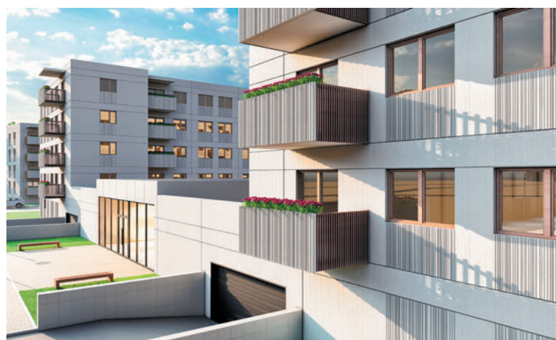
Entgegen der landläufigen Meinung sind Gebäude aus Betonfertigteilen nicht schlicht und langweilig - Beton ist einer der stilvollsten und bei Designern und Architekten beliebtesten Rohstoffe.