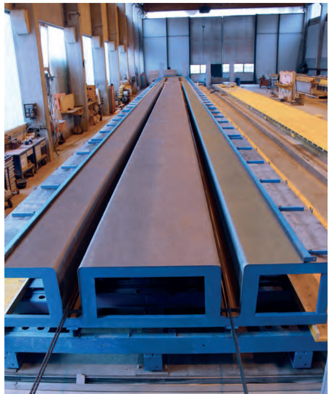
Für das Werk Schachen entwickelte Tecnocom ein flexibles Schalungssystem mit zwei verschiedenen Schalungen: mit der ersten, einer 46 m langen Schalung zur Herstellung von TT-Decken, werden derzeit die entsprechenden Betonfertigteile produziert.

Ein wichtiger Meilenstein auf diesem Weg war die Investition in ein Schalungssystem, mit welchem TT-Decken und stabförmige konstruktive Betonfertigteile nach Kundenwunsch gefertigt werden können. Die Wahl des Technologiepartners fiel auf Tecnocom, einem auf Sonderschalungen spezialisierten Unternehmen der Progress