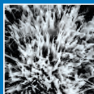
Cristallisation Xypex (achevée)

Les produits en béton préfabriqués enfouis dans le sol risquent de subir des infiltrations d'eau avec détérioration du béton. Les puits de visite et les fosses septiques sont particulièrement sensibles aux attaques de sulfate et d'acide causées par la corrosion microbienne. Xypex Admix apporte une solution unique à ces problèmes. Ajouté au mélange de béton, ce produit assure une imperméabilisation intégrale et une protection accrue contre les acides et les sulfates. Choisissez Xypex, choisissez le meilleur - avec plus de 40 années d'essais par des organismes indépendants et toujours inégalé .