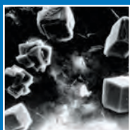
Béton (non traité)