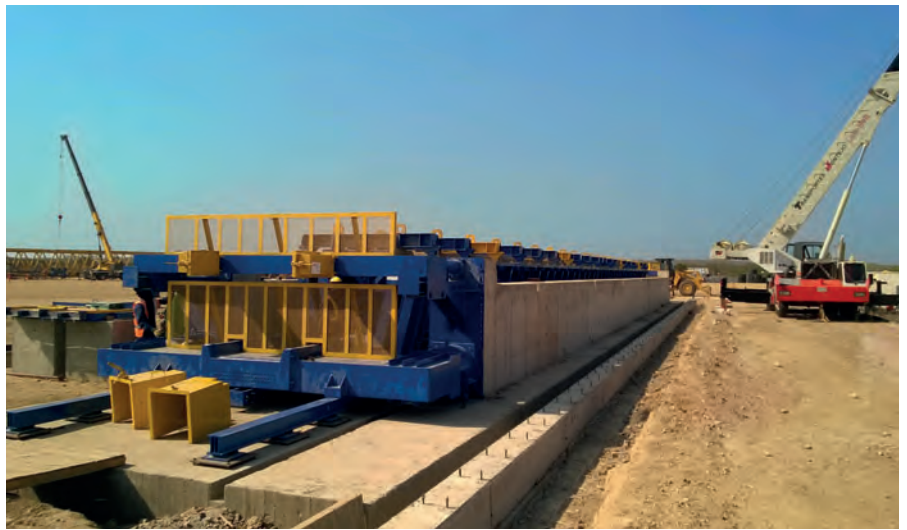
Le coffrage de 40 m a été installé non loin du chantier. Il peut être utilisé indépendamment du lieu car il dispose d'un système d'absorption des forces de précontrainte.

Un maillon important de la nouvelle liaison routière entre Carthagène des Indes et Barranquilla est le pont qui enjambera la lagune côtière de Carthagène des Indes. Sur quatre voies, le « viaducto Gran Manglar » doit enjamber la zone marécageuse au nord de la ville sur 5,4 km de long et devenir ainsi le plus long pont routier de Colombie. C'est l'entreprise générale Rizzani De Eccher, située dans le nord de l'Italie, qui a décroché la commande pour la construction du pont. L'entreprise active dans la construction de logements et d'infrastructures dans le monde entier s'est entre autres spécialisée dans la planification et la construction de ponts. Elle a confié à l'entreprise Tecnocom la construction, la production et le montage d'un coffrage pour la réalisation des supports en V nécessaires.