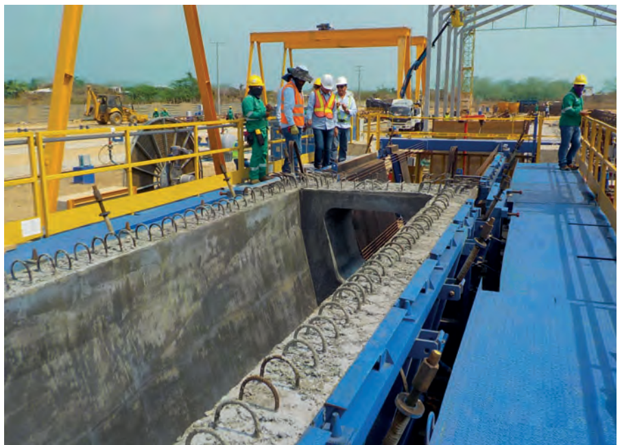
Un système de vibration et de chauffage assure un compactage et un durcissement homogènes du béton introduit. Pour le « viaducto Gran Manglar », le plus long pont routier de Colombie, des supports en V de trois longueurs différentes et d'un poids pouvant atteindre 85 t sont produits.