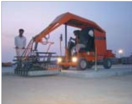
Verwendung von Optimas-Maschinen im Hafen von Doha (Qatar)

Verlegeleistung ermöglichen, indem sie intensive Schulungen direkt an der Baustelle anbietet und mit professionellen Pflasterverlegespezialisten zusammenarbeitet. Im Hafen von Doha arbeitet Optimas mit der Firma Mirage Paving aus Neuseeland zusammen, um eine erfolgreiche Fertigstellung des Projektes sicherzustellen.