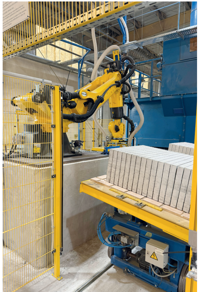
带有机器人上料系统的摆渡车系统