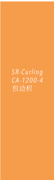
SR-Curling CA-1200-4 包边机