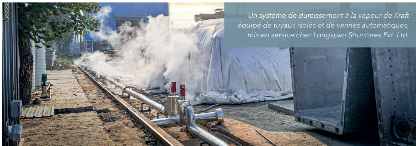
Un système de durcissement à la vapeur de Kraft équipé de tuyaux isolés et de vannes automatiques, mis en service chez Longspan Structures Pvt. Ltd.

nologies de cure avancées de Kraft Curing sont parfaitement adaptées pour répondre à ces exigences en constante évolution.