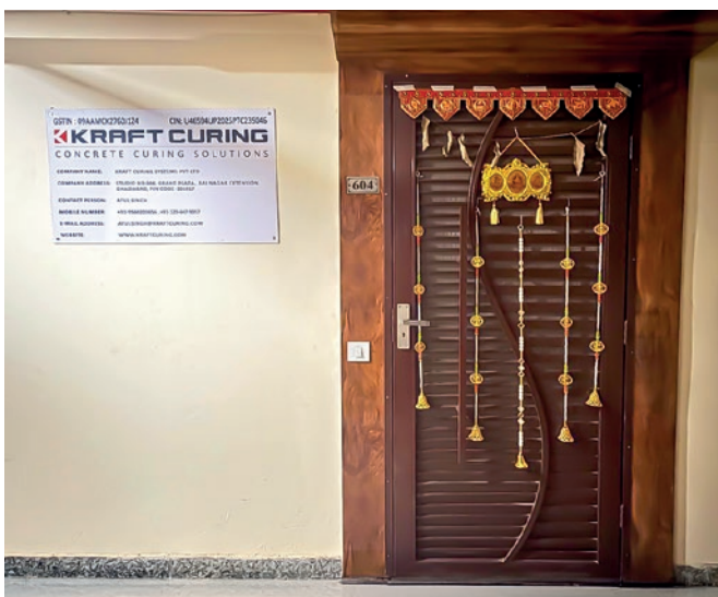
Entrée du nouveau bureau dans la région de Delhi NCR

Grâce à la croissance rapide de son industrie, à l'augmentation des investissements dans les infrastructures et à son intérêt croissant pour les techniques de fabrication modernes, l'Inde représente un marché stratégique essentiel pour Kraft Curing Systems. Alors que les fabricants indiens privilégient de plus en plus l'efficacité, la qualité et la durabilité, les tech-