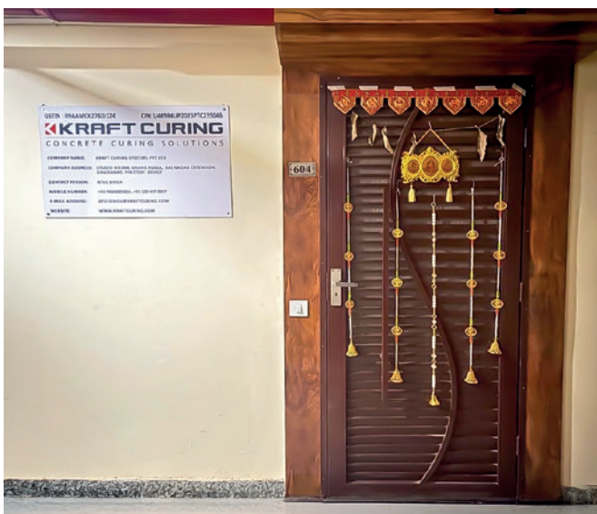
Entrada a la oficina de la región de Nueva Delhi NCR

Gracias a su vertiginoso crecimiento industrial, a las crecientes inversiones en infraestructuras y a la atención que presta cada vez más a los modernos procesos de fabricación, la India se ha convertido en un mercado tremendamente importante para Kraft Curing Systems. Como los fabricantes indios dan cada vez mayor importancia a la eficiencia, calidad y durabilidad, las tecnologías de curado de Kraft están muy