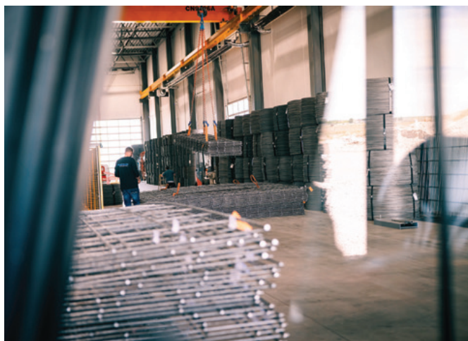
Matbar 成品钢筋构件展示