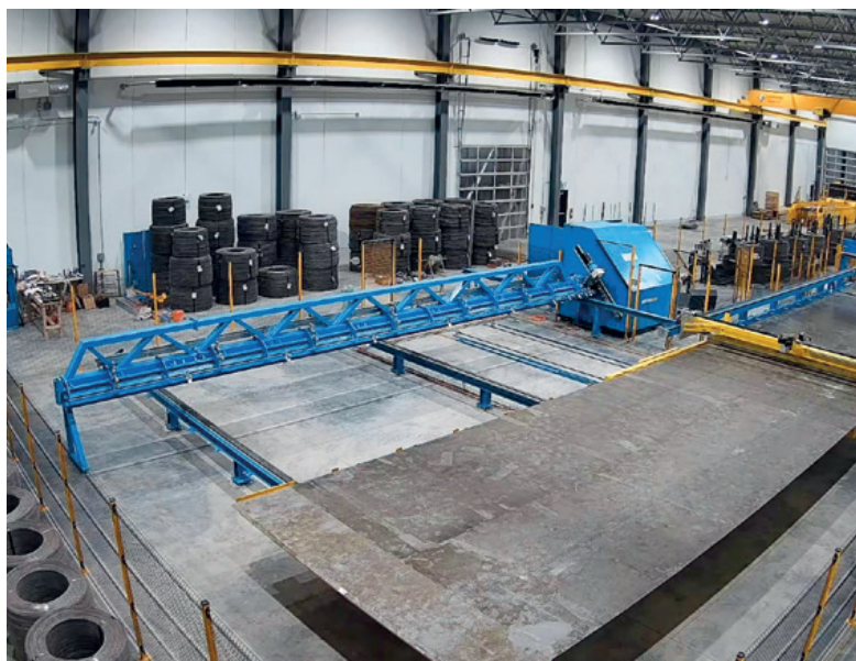
Matbar 公司全自动钢筋网片焊接生产线全景