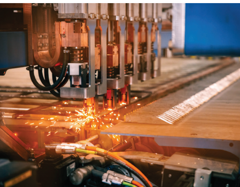
先进技术确保网片生产兼具卓越品质与稳定精度