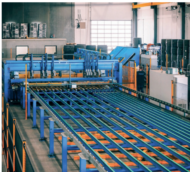
Matbar 公司全新的 M-System BlueMesh 钢筋网片焊接生产线

" 速度与精度是核心优势。使用过我们产品的客户, 最先称赞的正是其卓越品质, " 吉布森强调。