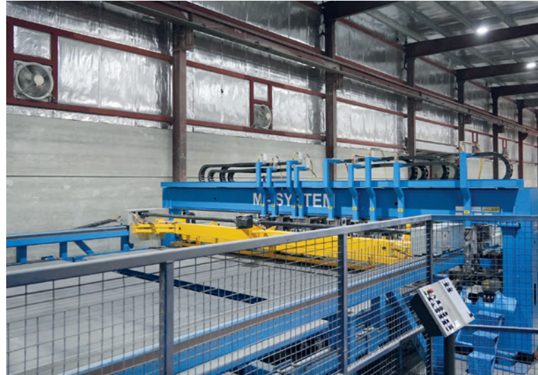
M-System 网片焊接设备实现了全自动化，大幅节省时间和人力