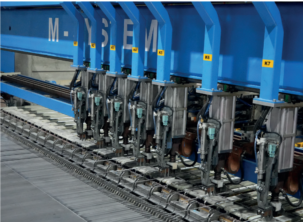
M-System 按照 CAD 设计图精确焊接所需的网片，从而减少材料浪费

片焊接设备，避免了延误，并节省了生产时间。这一精简的流程确保了钢筋结构的准时交付，这是预制件生产商在工厂运营中的关键环节。两台新的 M-System Evolution 设备配备独立弯曲头，可通过自动焊接和弯曲制造定制化的网片和钢筋笼。该网片焊接设备可焊接不同直径的钢筋，并自动完成钢筋弯曲，使组件可直接从机器输出并投入使用。凭借设备中配备的特殊弯曲头，各种类型的钢筋笼都能实现全自动化生产，仅需一台设备即可完成。这些创新不仅加快了生产速度，还拓展了 Al Rashid 能够提供给公共、私人及