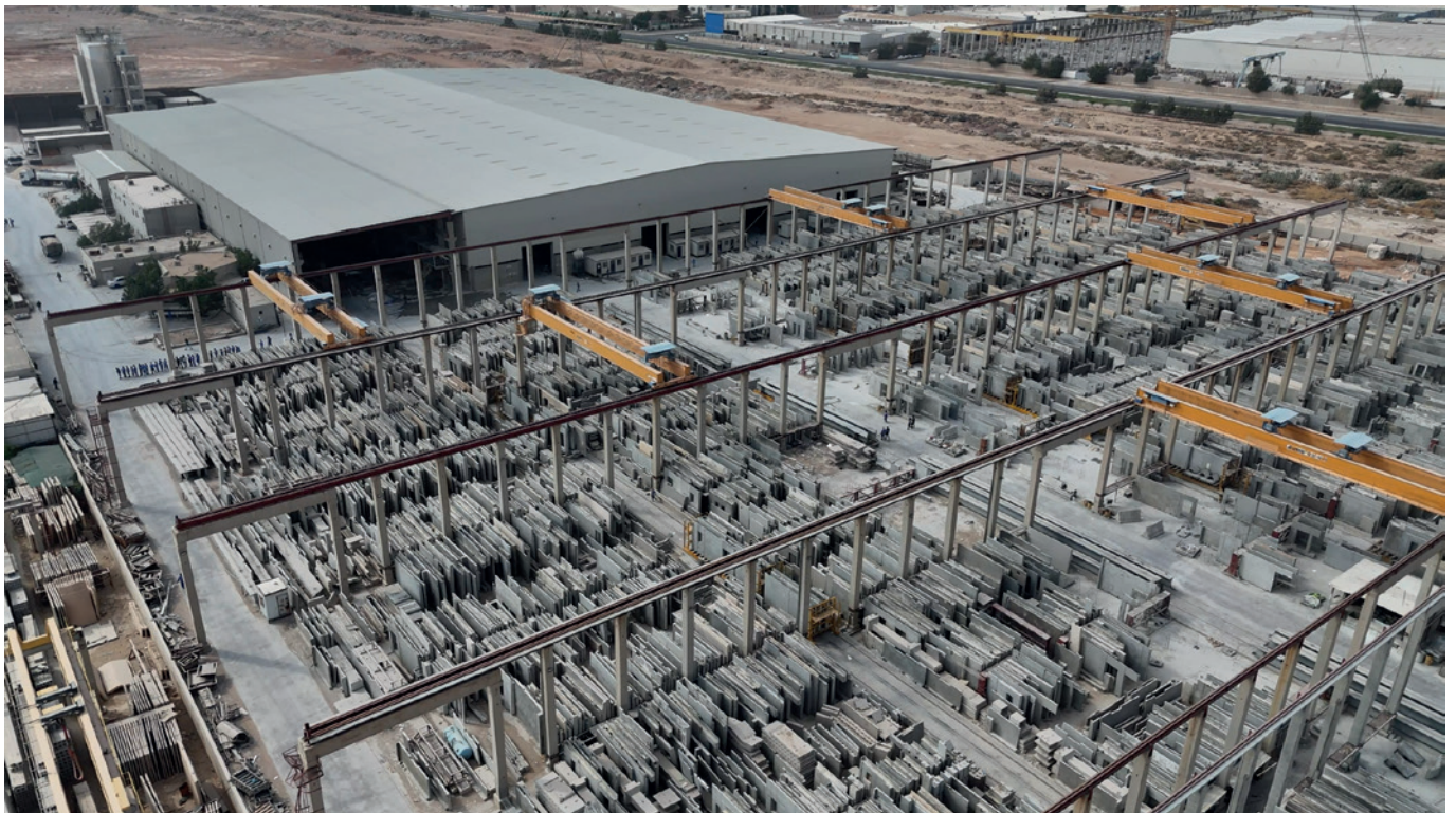
Al Rashid 采用 Progress Group 的钢筋加工设备实现现代化升级