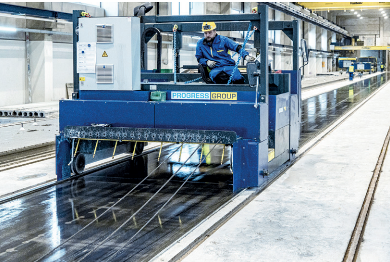
电池供电的多功能手推车用于设置(新的)生产线: 清洁、上油和拉动钢绞线/电线