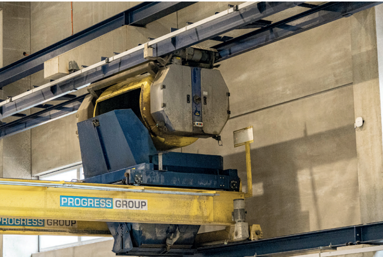
带桥的混凝土撒布机设计用于通过斗式输送机自动供应新鲜混凝土