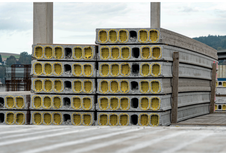
主要使用 Perg 工厂的构件建造大型项目，如家具市场和物流中心