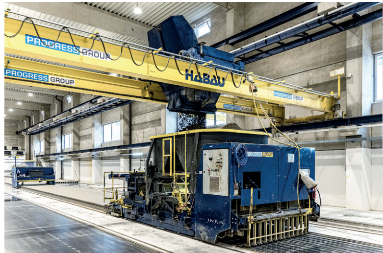
由于其特定的设计和使用湿土混凝土, S-Liner® 滑膜机被认为具有成本效益, 易于操作和维护