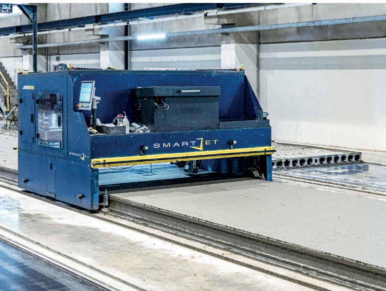
除了打印装置，SmartJet 绘图仪还配备了额外的钻孔装置

模块即可切换产品。此外，S-Liner 采用特殊设计和干硬性混凝土，操作简便、维护方便且经济高效。