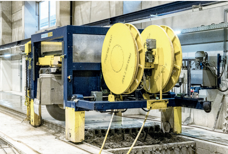
轨道导向锯床在硬化混凝土元素和新鲜混凝土中产生干净、精确的切割