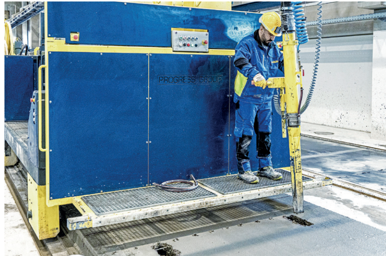
混凝土提取机主要用于从凹槽和开口中移除混凝土