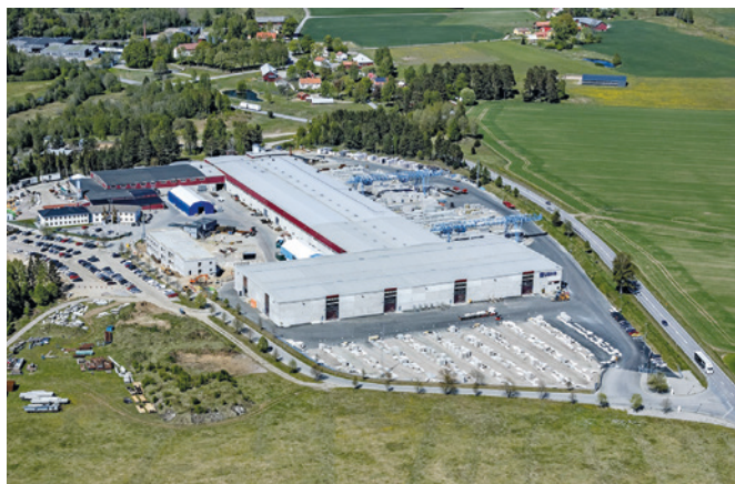
Gli stabilimenti di UBAB fanno parte del CRH Group dal 2023

UBAB gestisce tre stabilimenti specializzati: Lo stabilimento UBAB produce una vasta gamma di prefabbricati, quello Örs si concentra su pareti e muri di contenimento e lo stabilimento Dala è specializzato in diversi sistemi e di solai e pareti. Insieme, questi stabilimenti coprono quasi tutti i settori