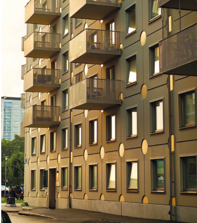
Progetto Lundbypark di UBAB, 166 nuovi appartamenti condivisi a Göteborg

La digitalizzazione in UBAB ha portato numerosi vantaggi: