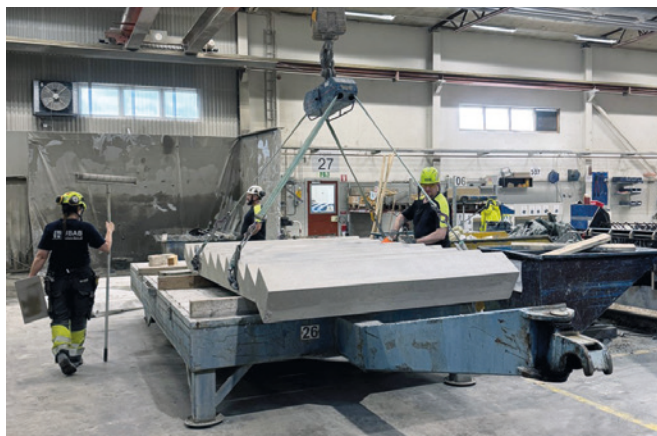
La produzione fissa di UBAB

Nel 2021 la UBAB svolgeva uno studio preliminare dettagliato per valutare vari sistemi ERP per gli stabilimenti di prefabbricazione. Grazie alle sue vaste possibilità e al supporto professionale, l'ERPbos del Progress Group risultò essere la scelta migliore. UBAB stima il Progress Group come fornitore, soprattutto per le sue dimensioni e quindi la garanzia di una lunga collaborazione e della disponibilità di consulenti tecnici. Inoltre, il Progress Group offre un sistema standardizzato che supporta molto bene i processi consolidati della prefabbricazione, una roadmap chiara per sviluppi futuri e vasti test nel proprio stabilimento, diventando così il partner