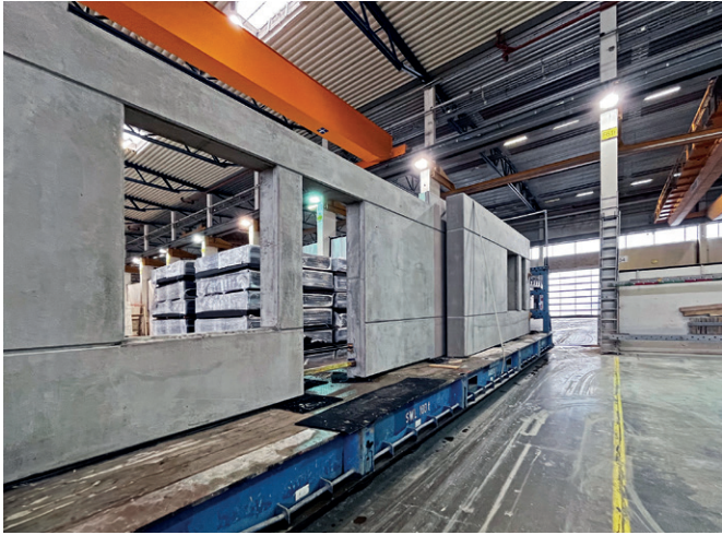
现在的数字化生产更加有效，最终产品的质量也更高

以前使用 AutoCAD 管理这个过程是繁琐和耗时的。通过提前过渡，UBAB 简化了计划流程，使其直观和基于规则。这不仅简化了对新员工的培训，而且将多个系统合并为一个系统，提高了效率，不仅减少了出错的可能性，还减少了执行计划本身所需的时间。