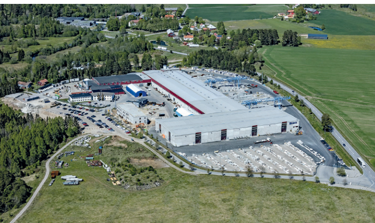
自 2023 年以来，UBABs 的工厂都是 CRH 集团的一部分

UBAB 经营着三家专门的工厂：UBAB 工厂生产各种各样的预制产品，örs 工厂侧重于墙体和挡土墙，Dala 工厂专门生产各种地板和墙体。总的来说，这些工厂覆盖了建筑相关预制产品的几乎所有方面，不包括空心板。这种多样化使得 UBAB 能够为客户提供全面的产品。