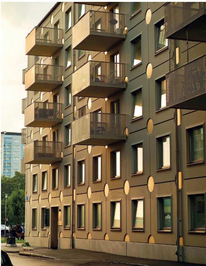
UBAB 的建筑项目叫做 Lundbypark，在 Gothenburg 有 166 个新的组合公寓

以前使用 AutoCAD 管理这个过程是繁琐和耗时的。通过提前过渡，UBAB 简化了计划流程，使其直观和基于规则。这不仅简化了对新员工的培训，而且将多个系统合并为一个系统，提高了效率，不仅减少了出错的可能性，还减少了执行计划本身所需的时间。