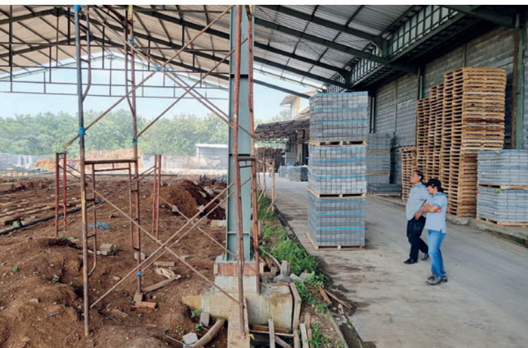
Фундамент для новой линии по производству бетонных блоков и брусчатки. Справа – машина для производства бетонных блоков и брусчатки Hess RH 1500-3, приобретенная в 2010 году

Сотрудничество между PT. Cisangkan и Hess Group продолжается уже много лет и за это время не раз доказывало свою успешность. Это давнее партнерство основано на общем понимании качества, инноваций и удовлетворенности клиентов. Поэтому решение о приобретении нового оборудования для производственной площадки в Пурвакарте стало логичным шагом в непрерывном развитии компании PT. Cisangkan. Пакет поставки включал в себя новейшую машину RH 1500-4 VA, систему транспортировки, состоящую из элеватора, вилочного погрузчика и опускного устройства грузоподъемностью 14 тонн каждый, новый пакетировщик Servo 700-2, а также конвейерные линии и кантователи. Первая сделка по приобретению машины Hess RH 600