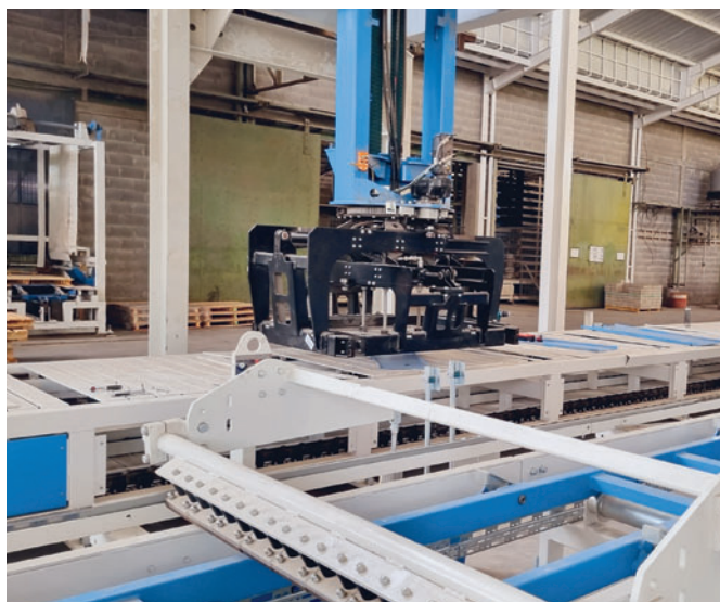
Пакетировщик Hess Cuber Servo 700-2

ния оптимальной производственной среды. Такая планировка позволяет легко интегрировать новую машину для производства бетонных блоков и брусчатки в существующие производственные линии и облегчает пересчет производства без необходимости масштабной реорганизации. Планировка новой линии RH 1500-4 представляет собой зеркальное отражение существующего завода RH 1500-3, что позволяет оптимально использовать смешительную установку, систему транспортировки производственных поддонов и вывоз готовых изделий.