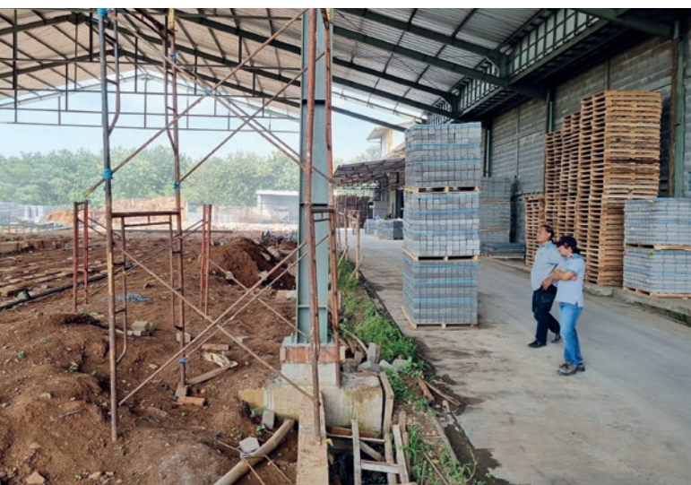
Prace fundamentowe pod nową linię do produkcji wyrobów betonowych, po prawej na zdjęciu hala wibroprasy Hess RH1500-3, która została zakupiona w 2010 roku.

Komponenty te sprawiają, że wibroprasa RH1500-4 pracuje szczególnie efektywnie, co prowadzi do znacznego wzrostu wydajności produkcji. Jest to szczególnie ważne w przypadku dużych projektów, w których czas i jakość są równie krytycznymi czynnikami. Wibroprasa jest znana nie tylko ze swojej wydajności, ale także z niezawodności i łatwości obsługi.