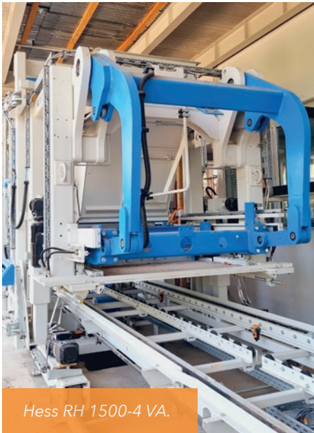
Hess RH 1500-4 VA.