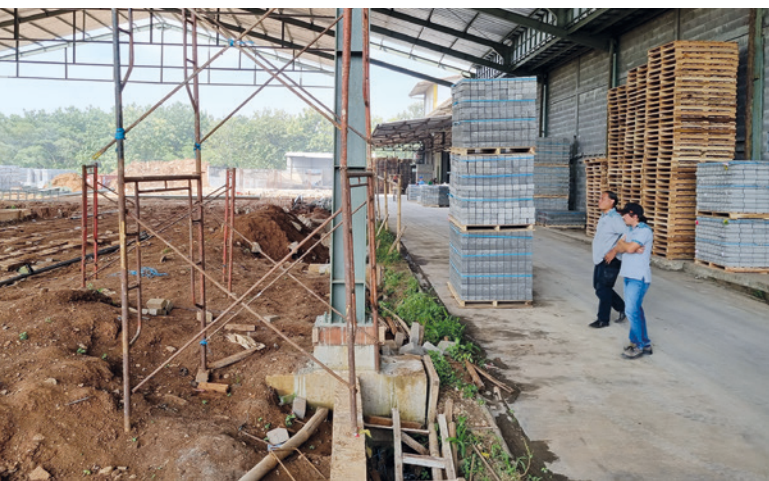
Lavori per le fondazioni della nuova linea per blocchi in calcestruzzo, nella figura a destra il capannone della blocchiera Hess RH1500-3, acquistata nel 2010.

Il primo acquisto di una Hess RH 600 A con carosello piccolo nel 2006 ha portato all'evoluzione tecnologica dell'azienda con la concentrazione su prodotti in calcestruzzo d'alto livello qualitativo. L'espansione sul mercato indonesiano è avvenuta con l'acquisto della Hess RH 1500-3 VA nel 2010, una blocchiera che convince ancora oggi grazie alla sua ottima performance e ai rispettivi componenti del carosello.