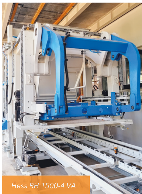
Hess RH 1500-4 VA