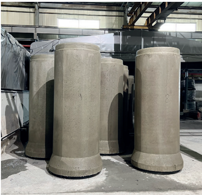
Распалубленные трубы DN 1000