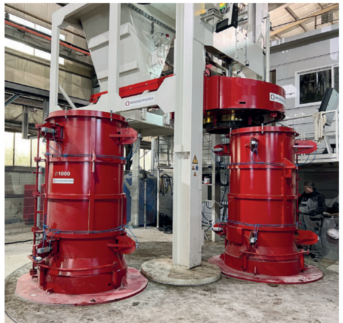
Производство труб с использованием двух пресс-форм

пространства в производственном здании и необходимости поддерживать в рабочем состоянии несколько существующих станков во время процесса установки. Для перемещения предварительно собранного радиального пресса потребовался кран грузоподъемностью 300 тонн - единственный доступный на острове Чеджудо. Весь персонал компании собрался за пределами завода, чтобы посмотреть, как радиальный пресс поднимают на высоту 30 метров и аккуратно устанавливают на фундамент через открытую крышу цеха. После успешной установки и запуска новой машины первые бетонные трубы DN 600 были выпущены уже в августе 2023 года. Сотрудничество Dongsung Concrete и Prinzing Pfeiffer, начавшееся в июне 2020 года с переговоров под руководством Андреаса Бартули (Andreas Bartuli), переросло в продуктивное и доверительное многолетнее партнерство. Система Radial