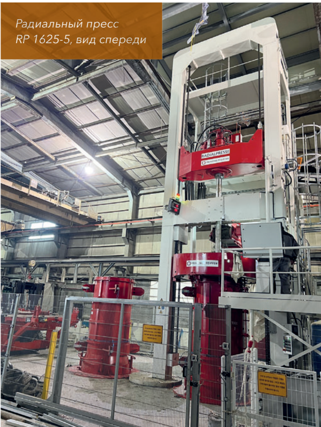
Радиальный пресс RP 1625-5, вид спереди