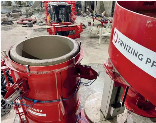
Размерная точность раструба