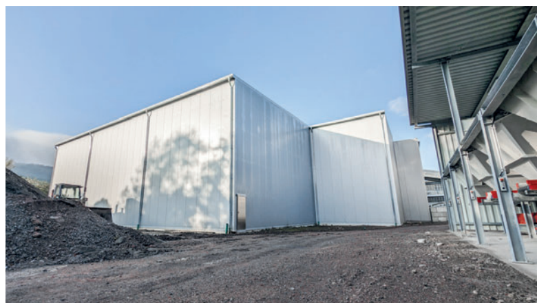
Камера для выдержки в виде отдельно стоящего здания и эвакуационная дверь из нержавеющей стали