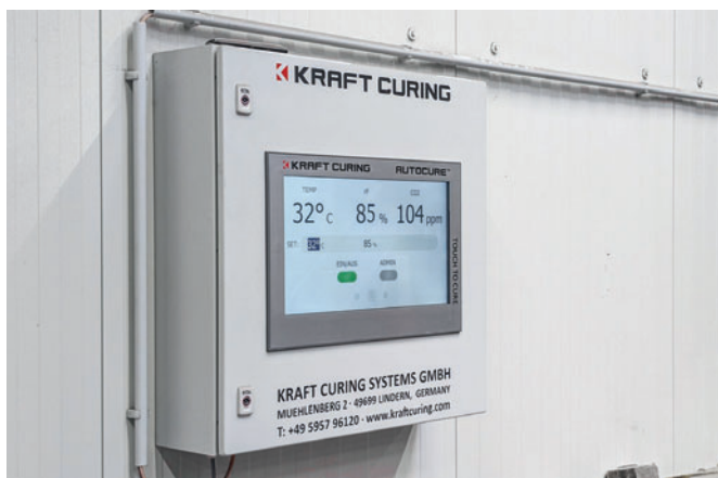
Управление камерой для выдержки с помощью программного обеспечения AutoCure

Сотрудничество между компаниями Kraft Curing Systems и Betonwerk Lintel по переоборудованию камеры для выдержки прошло очень успешно. За плечами обеих компаний – многолетняя совместная работа в качестве партнеров и, как следствие, высокий уровень доверия и взаимопонимания. Планирование и реализация переоборудования осуществлялись в тесной координации между двумя компаниями. Компания Kraft Curing Systems GmbH поделилась своим ноу-хау и практическим опы-