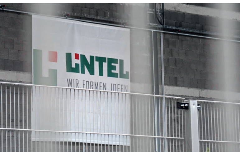
Группа компаний Lintel делает ставку на технологию выдержки от Kraft Curing Systems GmbH

Для нагрева воздуха была выбрана система мощностью 150 кВт/ч, которая подает горячий воздух в камеру по мере необходимости с общей производительностью до 35 000 м 3 /ч. Система паровлажностной обработки называется Quadrix и ускоряет процесс твердения за счет контролируемого добавления тепла и влаги. Специально разработанные алюминиевые радиальные вентиляторы и теплообменник из нержавеющей стали позволяют системе работать в условиях повышенной влажности. Системы были специально оптимизированы для ис-