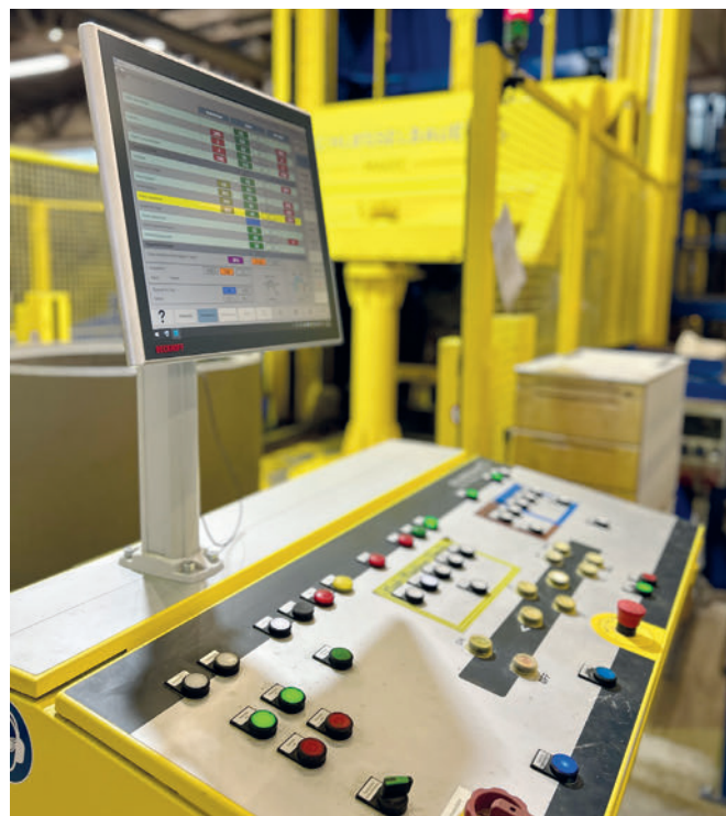
Utilisation confortable des commandes sur le pupitre central

Le type de machine Magic de Schlüsselbauer Technology mis en service chez Kühne est une installation de production universelle pour les produits de génie civil utilisée dans des usines à béton du monde entier. L'installation Magic est proposée en deux variantes, Magic 1501 et Magic 2500, pour les regards grand format. En outre, le client a le choix entre deux concepts d'installation : une seule machine avec transport manuel des produits ou une installation de circulation entièrement automatisée. Kühne a opté pour une seule