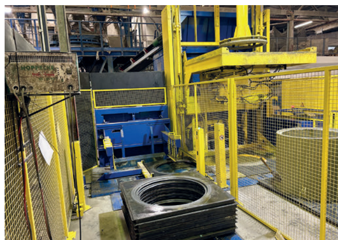
Introduction automatique des embases dans la machine