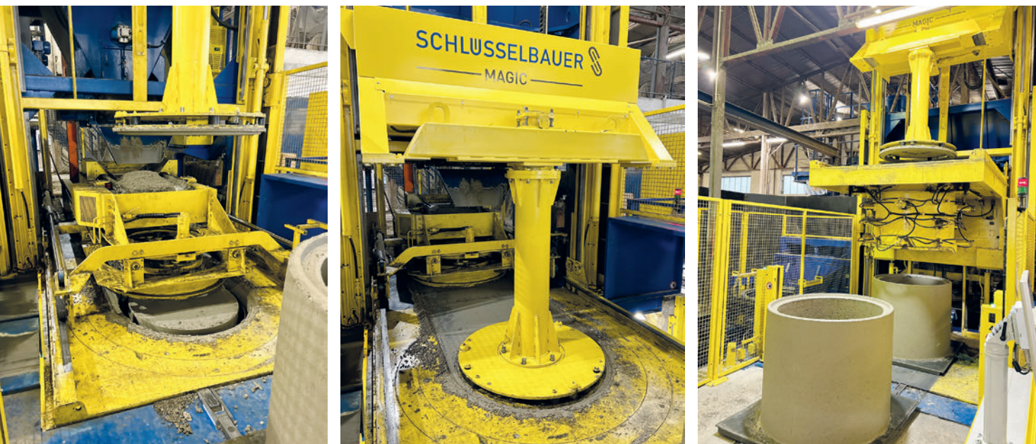
Fabrication d'un élément droit de regard sur la Magic 1501

machine, une Magic 1501. L'autre concept aurait été difficile à mettre en œuvre compte tenu de l'espace disponible. Les halls de production sont entièrement occupés et il est impossible d'augmenter davantage la surface de production sur le site actuel. La Magic 1501 est une installation de production d'éléments de regard tels que les regards et les têtes excentriques réductrices d'une hauteur allant jusqu'à 1 500 mm, mais aussi de divers éléments de génie civil en grandes séries. La machine permet de produire d'une à six pièces préfabriquées, et est conçue pour les produits d'un diamètre extérieur maximal de 1 800 mm lors de la fabrication d'un produit à la fois. Chez Kühne, la Magic 1501 permet de fabriquer des regards et des têtes réductrices.