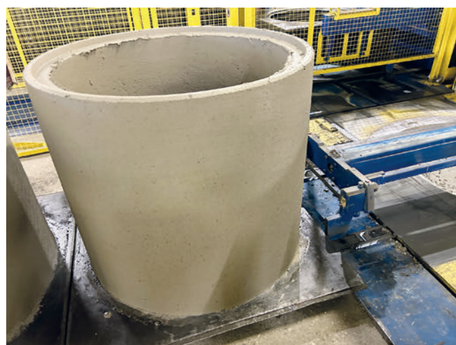
Le produit frais est poussé hors de la machine, sur son embase

Chez Kühne l'ensemble de la production d'éléments de regard est géré par trois collaborateurs, même si, à ce niveau d'automatisation, deux collaborateurs suffiraient. Kühne crée ainsi des conditions dans lesquelles les collaborateurs peuvent travailler de manière détendue et la production peut