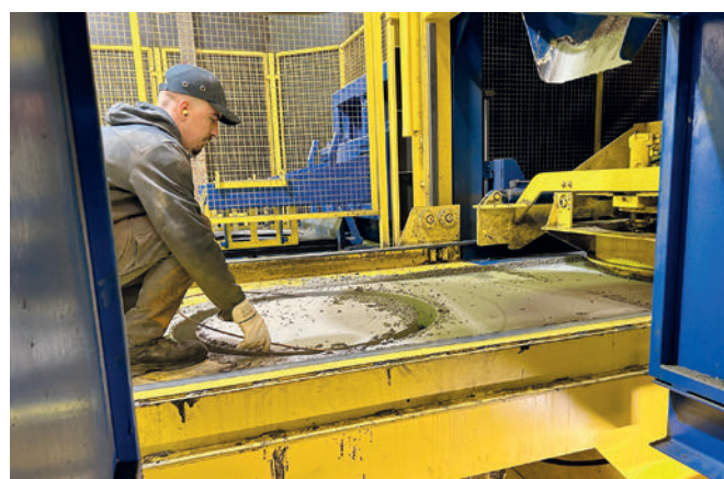
Insertion de la cerce d'armature juste avant la production