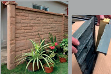
Double sided Random Rockface Post & Panel moulds made in rigid polyurethane for steel gangs