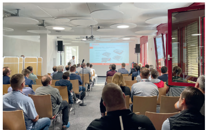
Ambas jornadas del evento consistieron respectivamente en una parte teórica con conferencias especializadas ...