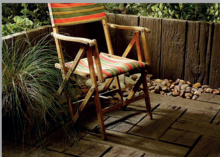
Timber Sleeper product used for flooring and walling