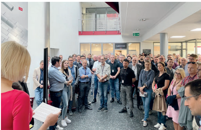
Con 180 participantes procedentes de 25 países, el 3º Simposio de Tecnología de Kobra volvió a ser un rotundo éxito.

La característica Flexshoe™ es una ayuda muy útil para la compactación, especialmente para productos de gran formato y formatos especiales. Los sellos con apoyos de goma brindan mejores resultados de compactación y una calidad superficial más elevada del bloque.