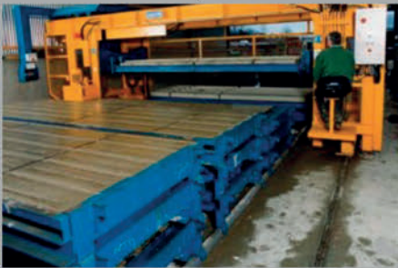
Client manufacturing plant using Cooite Machinery with Numold moulds