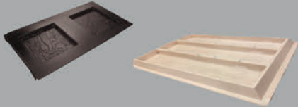
ABS Paving moulds in Gang format & Polyurethane Multi set up for Timber Sleeper. Both for use on automatic machinery