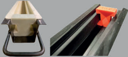
Heavy Duty Industrial 130x130 (5"x5") Post System for security fencing and boundary protection.

For use on automated machinery. Suitable for all machinery companies