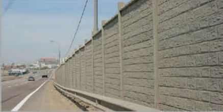
4m x 5"x4" Post & ABS Panels For motorway noise barrier