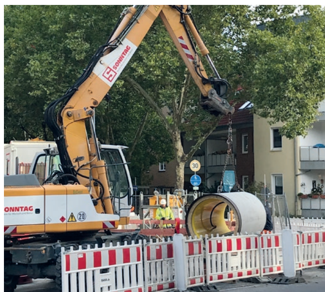
Projekt Dattel: Opuszczanie rury do studni startowej, widoczne przewody do podawania bentonitu.