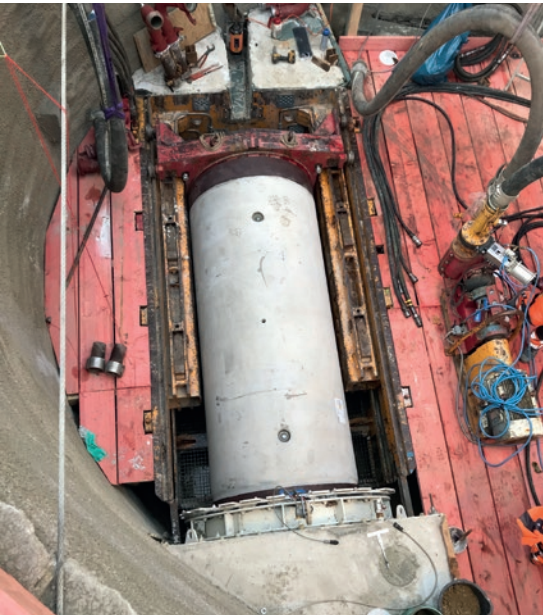
Projekt Dattel: Kolejna rura w przecisku od razu łączy się szczelnie z rurą poprzedzającą dzięki łącznikowi wtykowemu Connector.