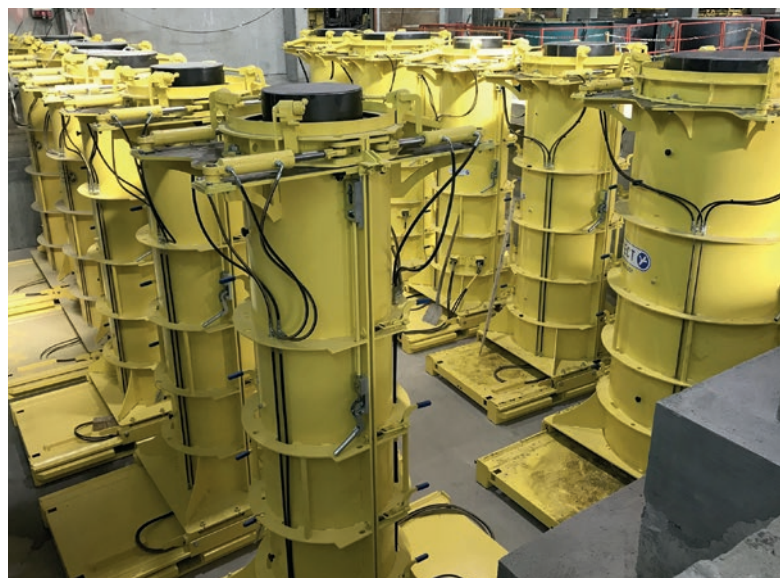
Produkcja rur przeciskowych w Beton Müller w formach Perfect od Schlüsselbauer Technology.