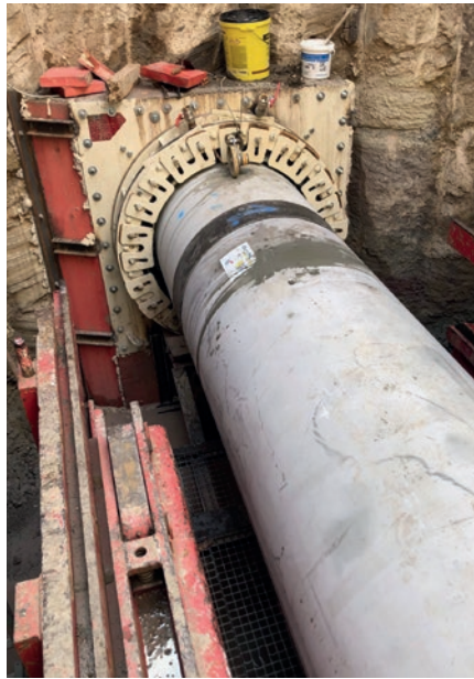
Medernach, Luksemburg: Studnia startowa, rura DN700.

jakości, co zapewnia gwarancję ciągłej ochrony rury przed korozją. Łączniki „Connector” doskonale uzupełniają cały system. Są one montowane w rurze przed umieszczeniem jej w studni startowej i zapewniają elastyczne, ale szczelne połączenie w złączach rur zarówno podczas instalacji (na przykład w przypadku, gdy rurociąg zostanie przesunięty w podłożu), jak i podczas eksploatacji. Dwie zewnętrzne uszczelki na złączu zapewniają dodatkową szczelność.