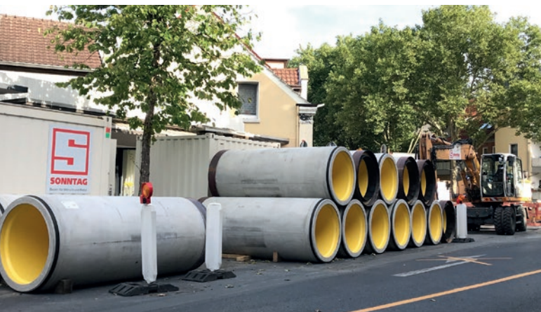
Projekt Dattel, Nadrenia Północna-Westfalia, Niemcy: magazyn rur przeciskowych Perfect Pipe DN1200 od Beton Müller na budowie.

Gdy jednym z warunków w projekcie kanalizacji jest ochrona przed agresywnymi chemicznie ściekami, pojawiają się pytania dotyczące wykonalności i trwałości w długotrwałym użytkowaniu. Kwestie doboru odpowiednich materiałów oraz warunków instalacji przekładają się na specjalne wymagania dla dostawców. W przypadku systemu Perfect Pipe, procesy spawania i formowania wykładziny są poddawane kontrolom