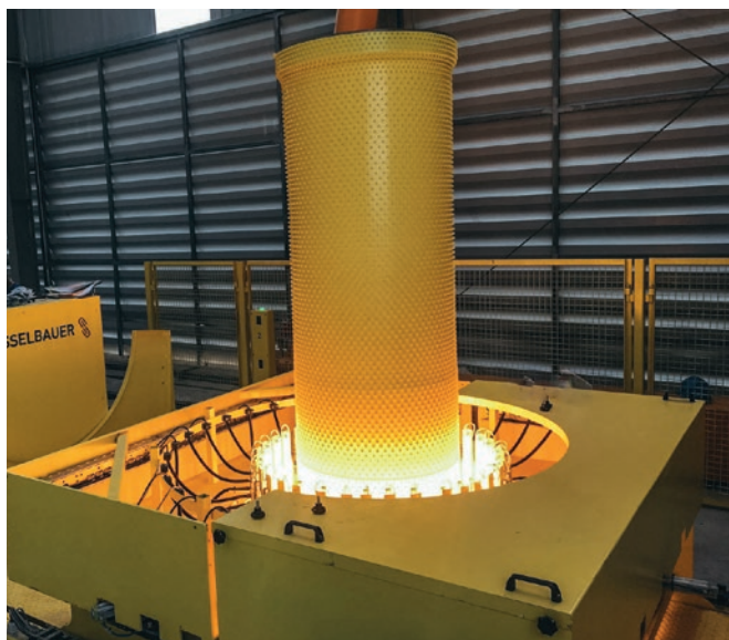
Termoplastyczne formowanie wewnętrznych kielichów wykładziny.