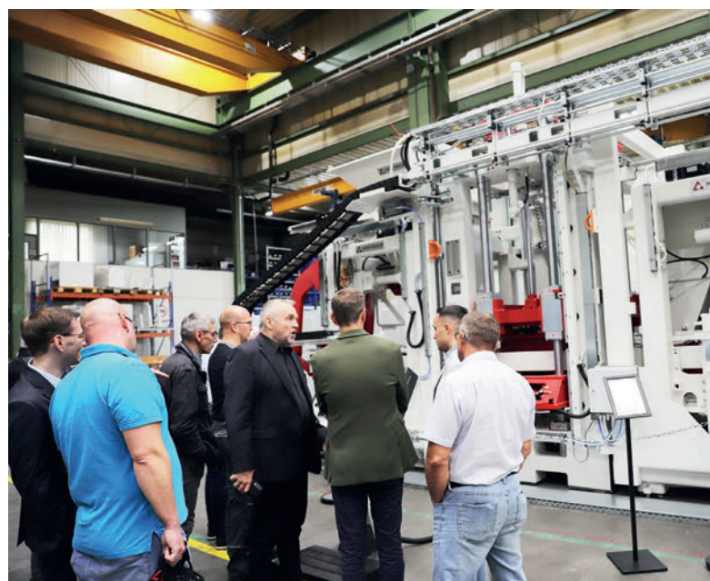
Das vielfältige Ausstellungsprogramm zeigte u. a. Maschinen wie die RH 2000-4