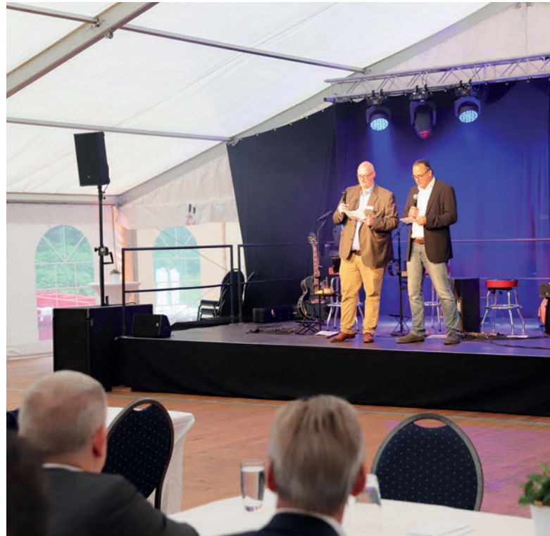
Begrüßung der Gäste zur Abendveranstaltung

Auch die Schwesterfirmen aus der Topwerk Group, SR Schindler, Prinzing Pfeiffer und Hess AAC, waren vertreten. Sie zeigten mit ihren Ausstellungsflächen die breite Palette und das Know-how des Unternehmensportfolios.