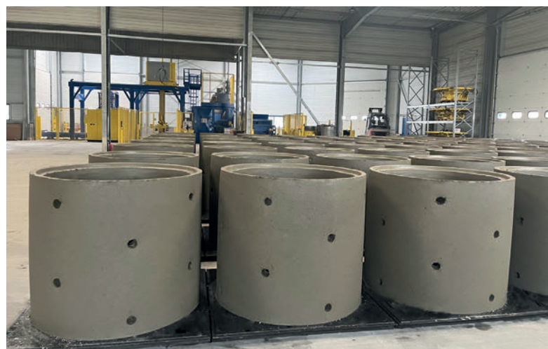
Ubicación idónea de la zona de endurecimiento (en este caso con anillos para pozos con perforaciones sépticas) en la zona de la nave entre la máquina de producción y la paletización.

Con sus tres máquinas de fabricación de pozos Perfect, Exact y la nueva Magic, las tres provenientes de Schlüsselbauer, disponen ahora de un gran potencial de producción que incluye una amplia gama de componentes para pozos DN 800 y DN 1000 y abarca desde las pequeñas placas de cubierta con una altura de construcción de 250 mm, anillos para pozos –optativamente con o sin perforaciones sépticas–, bases para pozos –optativamente por separado o con canalización estándar– hasta con cono de pozo de una altura de construcción de 2400. La mayor parte de productos se ofrecen con