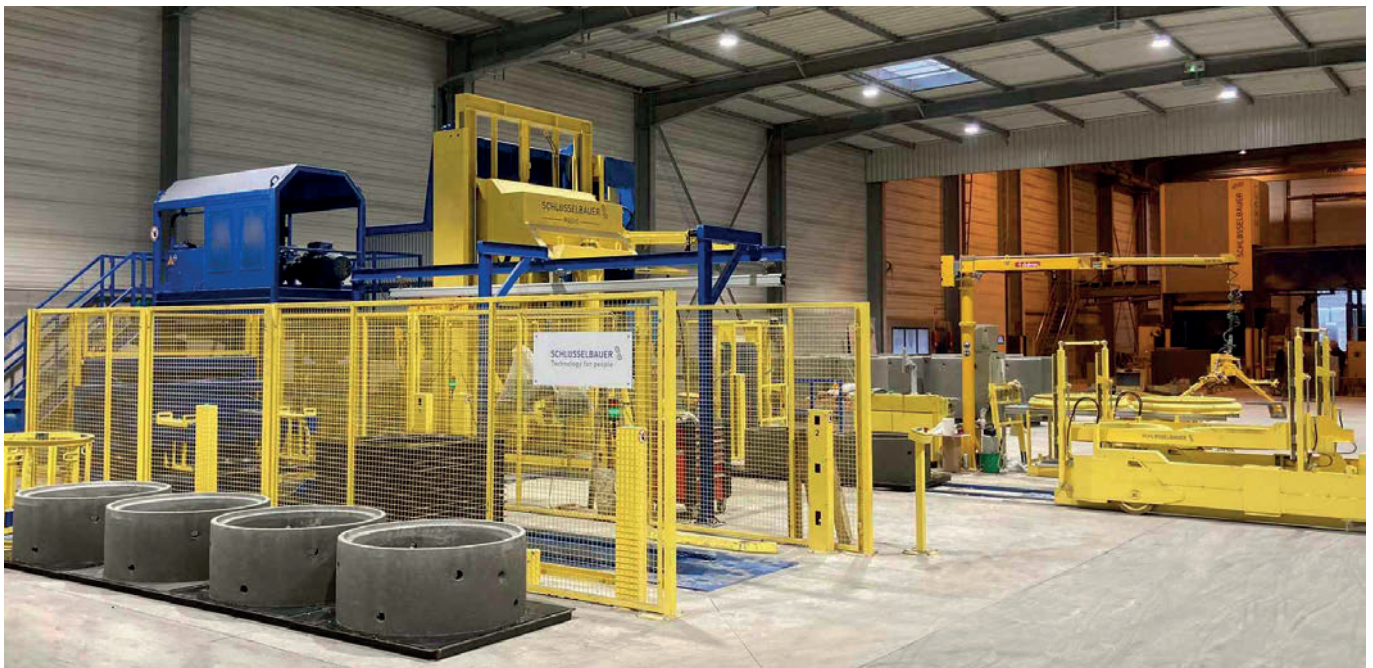
La nueva Magic 1501. Al fondo se ve la máquina Exact.

Villefranche-sur-Saône está media hora al norte de Lyon, en el centro neurálgico de una región dinámica de gran capacidad económica y es la sede de Plattard desde 1885. A lo largo de su progreso, esta PYME familiar se ha apoyado en dos ámbitos económicos importantes: la industria y el comercio. El grupo Plattard es conocido en Francia por la calidad de sus productos, en concreto, ladrillos huecos de hormigón y piezas prefabricadas de hormigón para la construcción de carreteras y el alcantarillado. Además, Plattard dispone de una red de distribución regional muy eficiente de materiales de construcción en la zona de Rhône-Alpes.