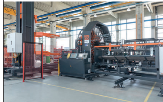
Máquinas soldadoras de armaduras para pozos de registro y tubos de hormigón