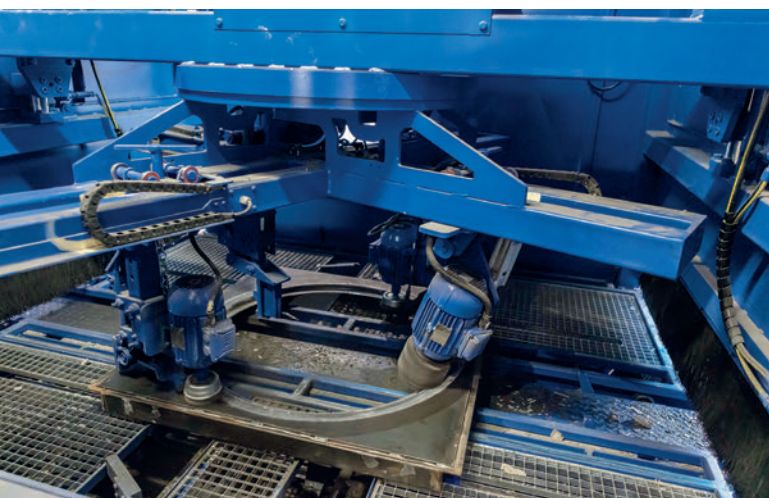
Unidad de limpieza para el encofrado inferior, junto con el engrasado sin pulverización: un clásico de los sistemas de paletización de Schlüsselbauer.

que se construyó a pocos metros de distancia de la anterior, y una pequeña ampliación del edificio para instalar el nuevo sistema de paletización. Esta formidable obra de ampliación consiguió que el edificio sea más diáfano y moderno, además de aportar más superficie para aumentar la zona de endurecimiento. Después, Plattard retiró la máquina anterior y completó la fosa mientras que los primeros camiones iban llegando: hasta 3 entregas de camiones a la semana. El día planificado, el 1 de agosto, los instaladores de Schlüsselbauer comenzaron a montar la nueva Magic, que estuvo lista tres días después, en el centro de una nave industrial completamente reformada.