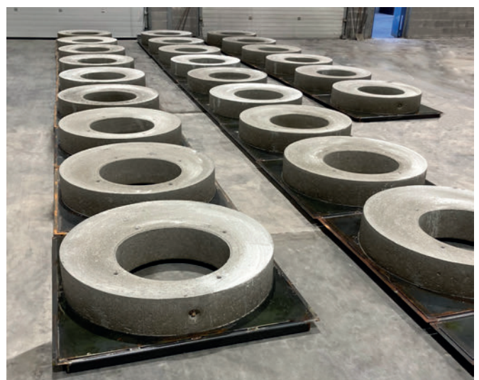
Placas de cubierta: un producto que cada vez tiene más demanda en Francia.

máquina nueva estuviera en el mismo edificio: un gran reto que consiguieron superar con creces los equipos de Plattard y Schlüsselbauer. La nueva maquinaria se diseñó teniendo en cuenta dicho requisito y, por supuesto, considerando el suministro de hormigón y las zonas del almacén exterior para los productos fabricados. Por tanto, a medidas de julio de 2022, el edificio estaba preparado junto con la nueva fosa,