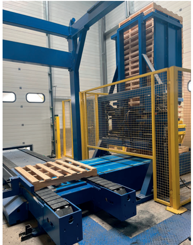
El depósito de palés se carga desde fuera, que es más fácil y seguro.

Ambas empresas han podido utilizar el tiempo para proyectar y fabricar la maquinaria en Austria con el fin de elaborar una planificación más precisa de instalación. El objetivo era interrumpir lo menos posible la producción. Por eso, Jacques Plattard estableció desde el principio en 2021 al realizarse el pedido que el plazo del montaje comenzara el 1 de agosto de 2022 para aprovechar, entre otros, el periodo de tiempo habitual de las vacaciones de verano. Antes, se tuvo que seguir produciendo con la Magic anterior hasta que la