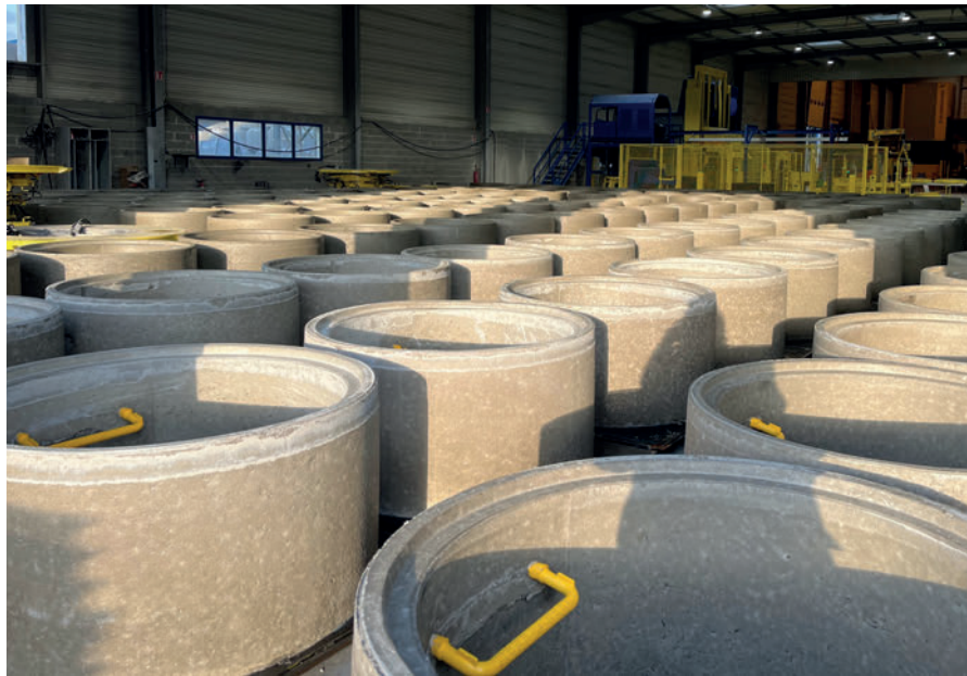
Anillos para pozos con estribos y anclajes

o sin anclajes, con o sin estribos, con o sin refuerzos y en dos modelos diferentes (en función de la unión). Gracias a haber aumentado la capacidad y confiando en la fiabilidad de su maquinaria, Plattard, con base en sus dos pilares principales de calidad y servicio, se ha equipado de la mejor forma posible para superar los retos del mercado de pozos que cambia tan rápido. ■