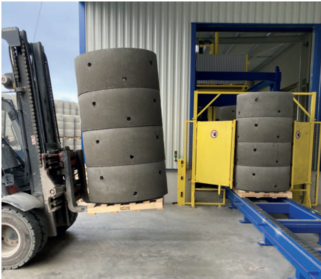
El transporte de productos fabricados apilados en palés. Se ha mejorado la colocación de la cinta transportadora: a lo largo de la nave bajo una marquesina en una zona protegida junto al carril y la zona del almacén exterior.

que se construyó a pocos metros de distancia de la anterior, y una pequeña ampliación del edificio para instalar el nuevo sistema de paletización. Esta formidable obra de ampliación consiguió que el edificio sea más diáfano y moderno, además de aportar más superficie para aumentar la zona de endurecimiento. Después, Plattard retiró la máquina anterior y completó la fosa mientras que los primeros camiones iban llegando: hasta 3 entregas de camiones a la semana. El día planificado, el 1 de agosto, los instaladores de Schlüsselbauer comenzaron a montar la nueva Magic, que estuvo lista tres días después, en el centro de una nave industrial completamente reformada.