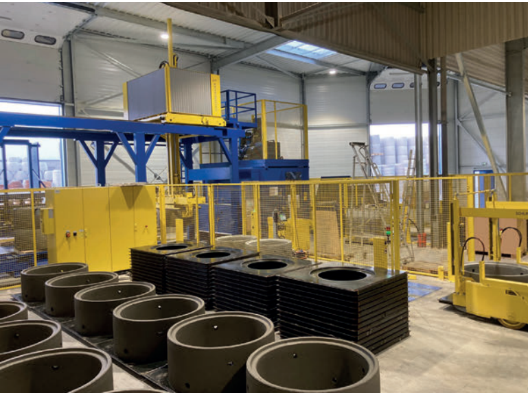
Vista de la paletización en la obra de ampliación.

productividad de 200 componentes para pozos por turno o aún más en el caso de los productos de altura intermedia y complejidad intermedia como los anillos para pozos DN 1000 de una altura de construcción de 600 mm, con dos anclajes y dos estribos.