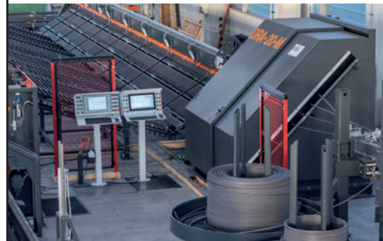
Máquinas para enderezar y cortar alambre