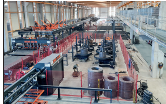
Máquinas soldadoras de mallas para elementos prefabricados de hormigón, marcos y mallas específicas del cliente