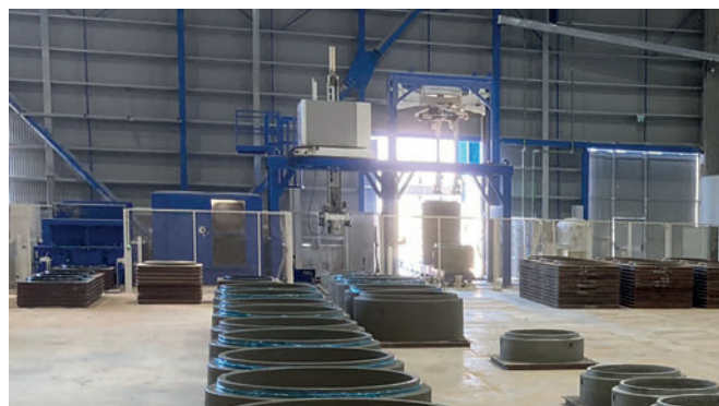
Oltre alla produzione vera e propria, la palettizzazione dei prodotti, la pulizia e l'oliatura dei fondelli inferiori sono completamente automatizzate.

Schlüsselbauer Technology GmbH & Co. KG Hörbach 4, 4673 Gaspoltshofen, Austria T +43 7735 71440 sbm@sbm.at , www.sbm.at