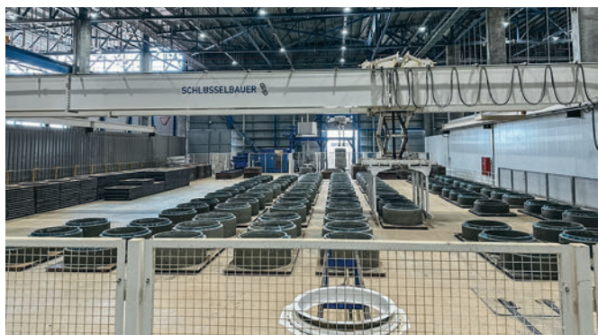
L'area di indurimento per anelli per pozzetti standardizzati con la gru automatica Transexact.

Con questa nuova tecnologia di produzione, Sela dispone di uno degli impianti per pozzetti più moderni dell'intera regione mediterranea in termini di capacità produttiva e qualità dei componenti. Per lo sviluppo dell'azienda nel paese,