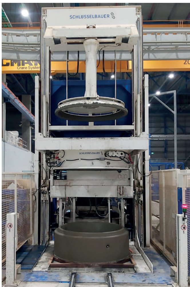
Il sistema Magic per la produzione in serie di anelli per pozzetti con larghezze nominali di 800, 1000, 1250 e 1500 mm.

in modo completamente automatico fino a quando non si trovano all'esterno del capannone sul nastro di scarico pronti per il trasporto all'area di stoccaggio.