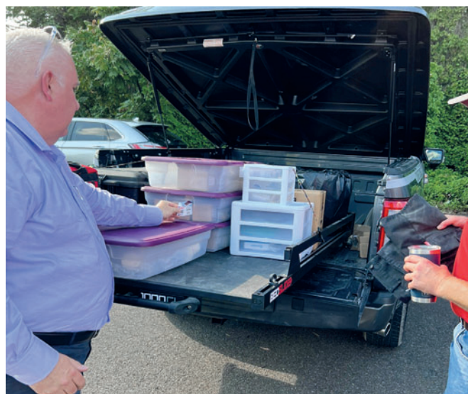
Сервисные автомобили укомплектованы запасными частями, инструментами и измерительными приборами