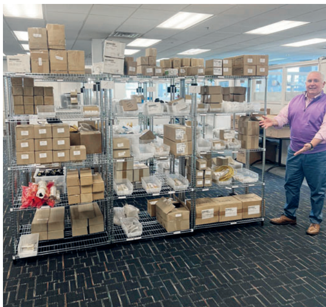
Склад запчастей в Филадельфии

производственные графики заказчика не были нарушены. Инвестиции в сервисное обслуживание имели место не только в США, но и в Европе. В этом году на производственном предприятии в Линдерне, Нижняя Саксония, был построен склад запасных частей. Это позволило исключить длительные сроки поставки электрических и механических компонентов и предложить еще более быстрый и эффективный сервис. Компания Kraft Curing Systems поставила своей целью решать вопросы своих заказчиков в течение 24 часов. Клиенту гарантируется быстрая доставка запасных частей и поддержка на месте - независимо от того, в какой стране находится завод. Таким образом, компания следует собственной философии: «Нет ничего невозможного. Для каждой проблемы существуют индивидуальные и быстрые решения. В первую очередь необходимо поддержать клиента, а затраты и усилия не должны быть в приоритете».