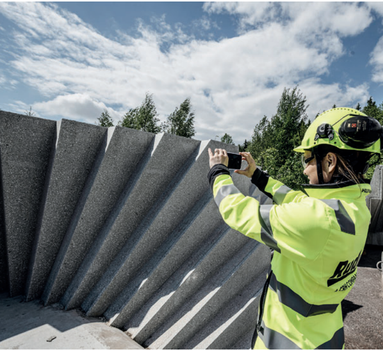
В компании Rudus 200 человек используют систему ERP

офисом ERP. Rudus также работает с мобильным приложением, позволяющим пользователям общаться с e rbos ® в любом месте и в любое время.