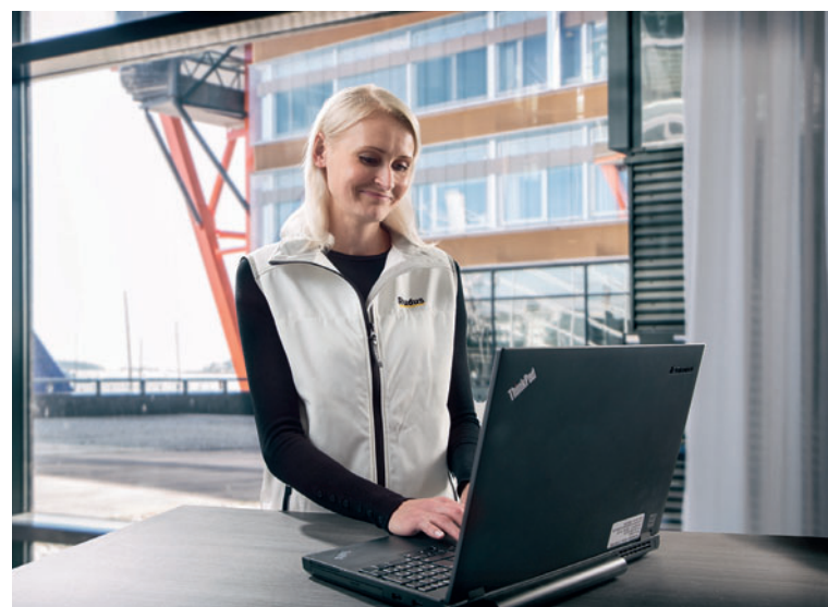
Новая система ERP позволяет управлять всей технологической цепочкой централизованно и работает на разных заводах Rudus