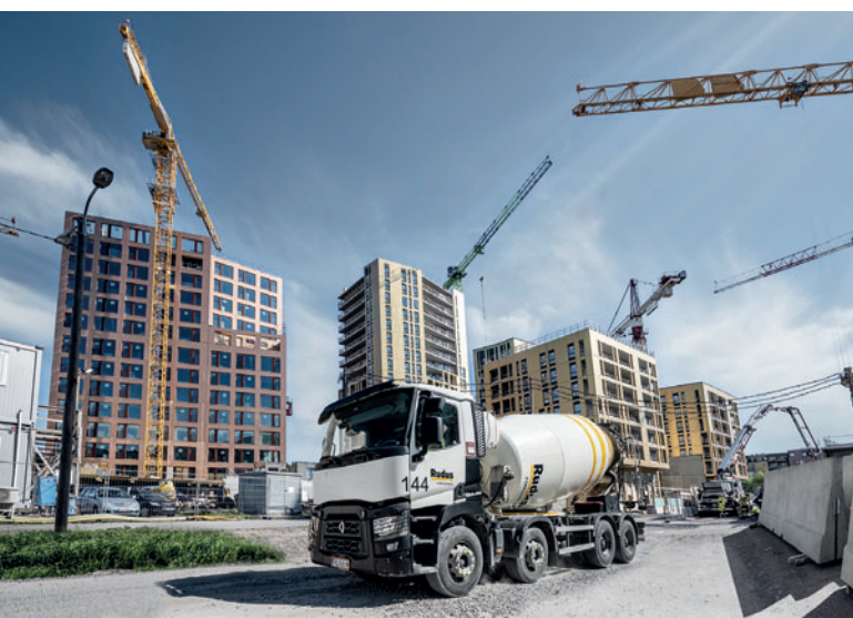
Компания Rudus сделала важный шаг к цифровизации с помощью Progress Software Development для того, чтобы оставаться впереди в каждом процессе производства и строительства

Благодаря высокоспециализированным конфигураторам продаж все шесть групп продукции теперь используются в e rbos . По этой причине необходимо было учесть десятки различных специальных характеристик. Поскольку e rbos имеет открытую настраиваемую структуру, он может быть легко интегрирован с другими системами. В случае Rudus решение сопряжено через интерфейсы с транспортными поставщиками, инструментами отчетности, интернет-магазином, оптовыми клиентами и бэк-