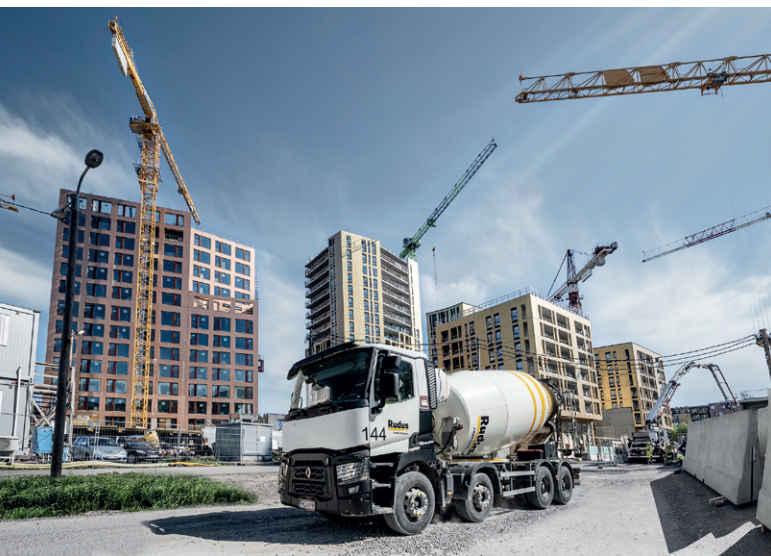
Rudus 迈出了重要的一步，通过 Progress Software Development 实现数字化，在生产和构建的每一个过程中都保持领先地位