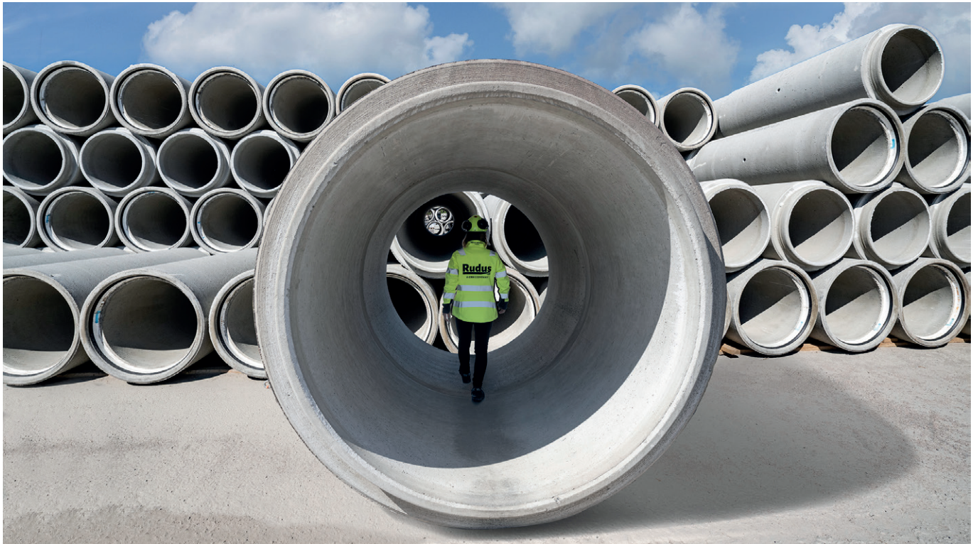
通过一个统一的软件解决方案，所有的元素都可以按照计划顺利地、准确地生产出来

性，并以有针对性和可持续的方式促进循环经济。这与 Progress 团队的使命完全一致，即“为人们创造可持续的更好的生活条件”。关注相同的价值观有助于行业合作伙伴忠于他们的使命和目标。