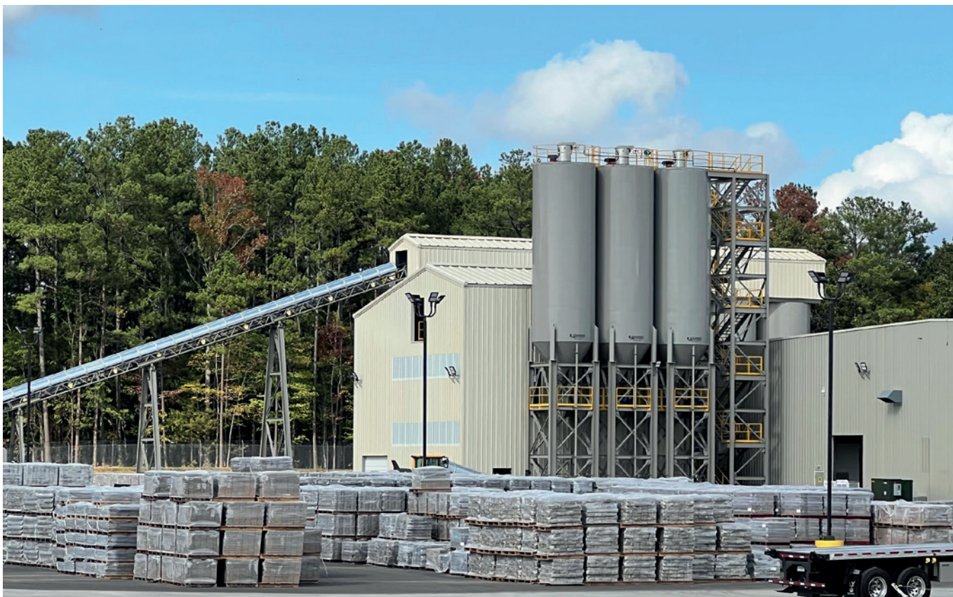
新的 Oldcastle Adams Ridgeway 工厂位于哥伦比亚 South Carolina 市外，生产高质量的高产量产品，服务于区域市场