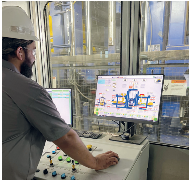
实时动画控制允许操作员从多个屏幕上看到任何阶段的所有过程

全部由 Standley Batch 提供并操作。三个水泥筒仓用于两台 Haarup 3750L 主拌机和 500L VM 面拌机。混合器下面的颜色漏斗为多色混合系统提供可测量的流量装置。Egan Controls 用于骨料配料、混合和给料系统。