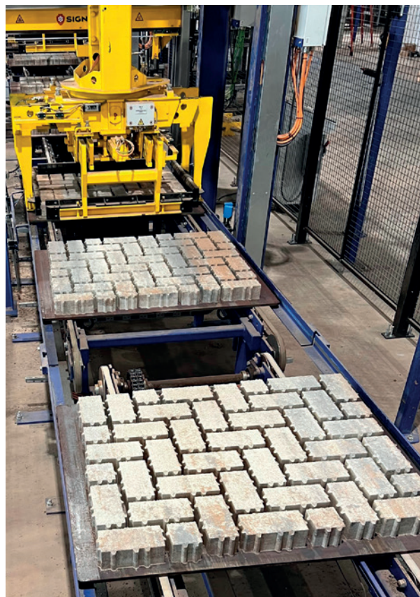
Masa 的电驱动立体升降机精确地将栈板放置在输送系统上，并在不损坏产品的情况下生成精确的立方体