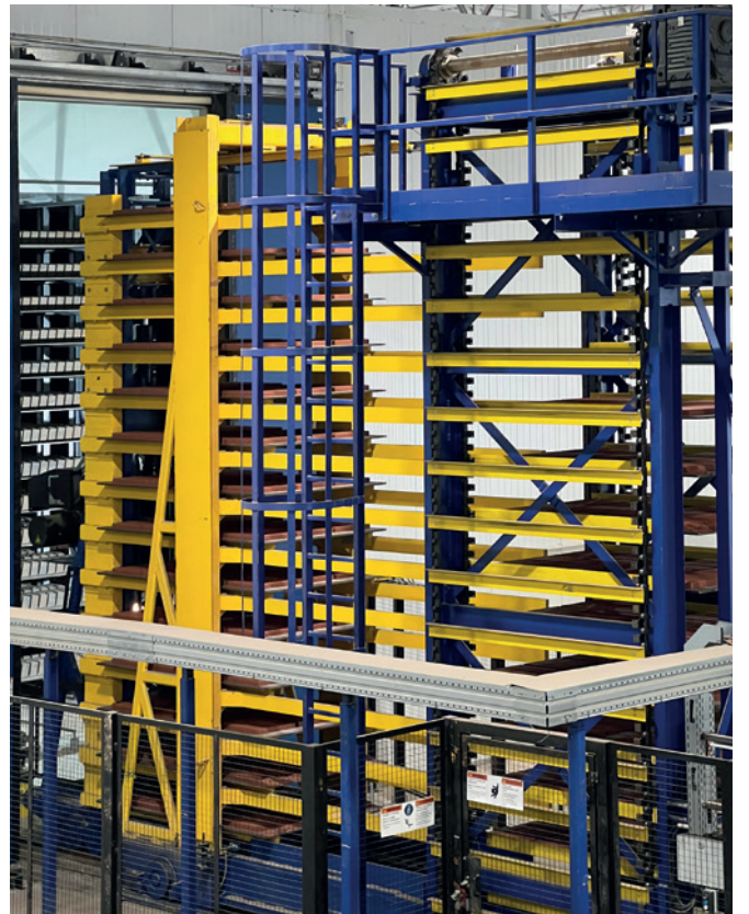
Masa 指车操作在单室固化室内

单室固化车间由 14 层双升降车进行灌装和清空。这种重容量、完全旋转的手动车系统,其功能螺栓上的手指是便于操作维护。干侧的 V 型带输送机有助于保持低干侧循环速度,以确保最大的日产量。一个定心装置和一个低压绑扎器构成了干侧线组件。