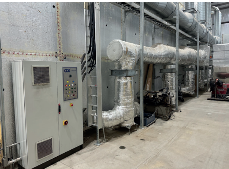
CDS 活性固化室环境控制保持温度和湿度

CDS 主动养护系统，能够独立、自动保持温度和湿度，在整个窑内不分层。CDS 系统使用湿度和温度控制相结合的大量空气流量，为用户提供特定产品的最佳温控设定点，以获得一致和可重复温控结果。