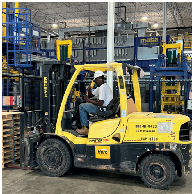
为 Ridgeway 的新工厂点赞

高质量的产品，并已证明自己是生产高质量产品。”我们期待着多年来继续为客户提供产品和服务。 ■