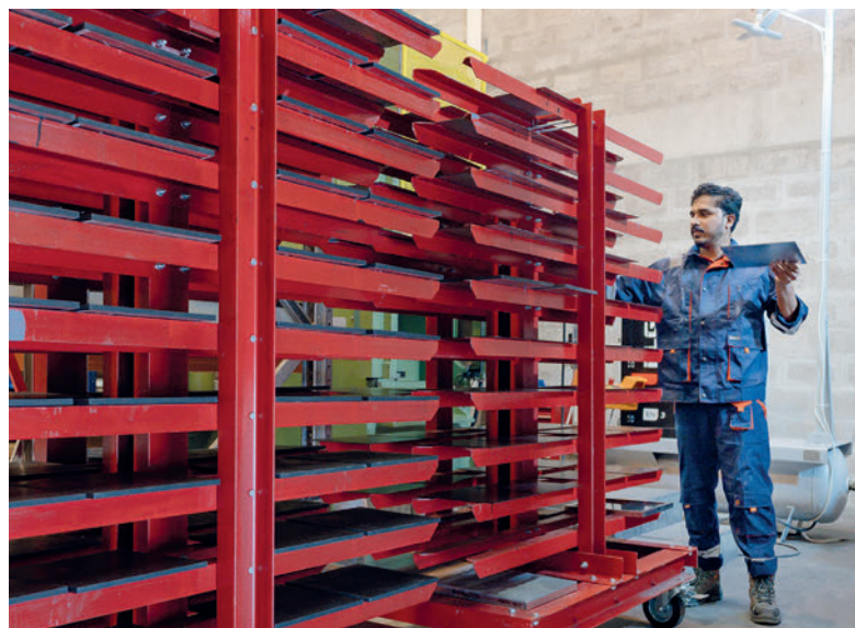
Produzione di matrici nella sede di Topwerk Middle East a Dubai.