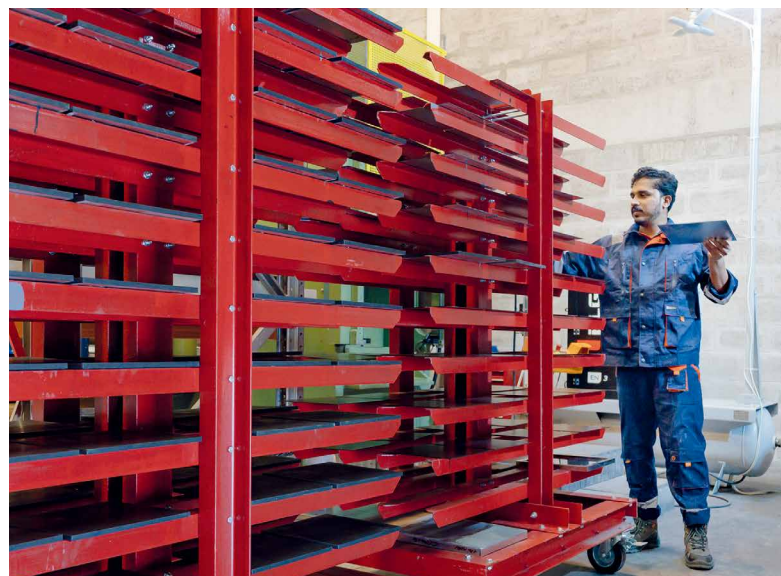
位于迪拜的 Topwerk 托普维克中东分公司为定制化的混凝土板材生产橡胶矩阵模具

措施确保客户的满意度和售后业务的可持续发展。“我们注意到，优质橡胶矩阵模具市场存在巨大缺口；许多技术陈旧的设备需要很长时间来更换矩阵模具，这既花费金钱又降低效率，” Topwerk 托普维克中东分公司的技术总监 Bassem