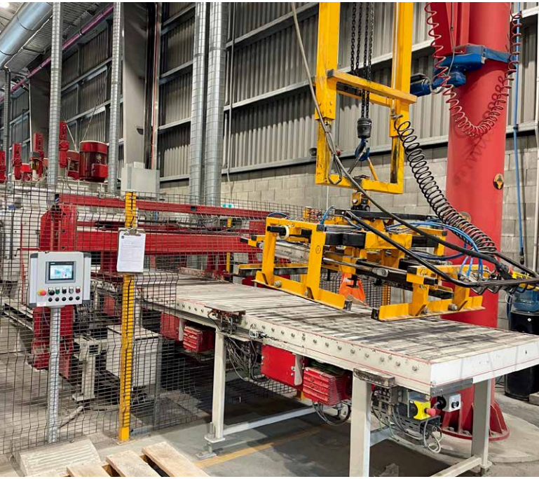
采用回转式起重机和4面夹具进料，置于安全系统内的辊式输送机