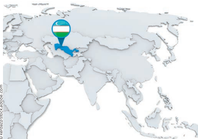
L'Ouzbékistan, un lieu attractif pour les investissements et le commerce

L'année 2020 a également marqué le début de la relation commerciale entre AKFA Group et Masa. Les machines et les équipements allemands ont traditionnellement une bonne réputation en Ouzbékistan. Il n'est donc pas étonnant que l'AKFA ait cherché à établir un premier contact avec Masa lors du salon UzBuild à Tachkent. Le groupe AKFA, la plus grande entreprise privée ouzbèke, est actif sur le marché depuis 2000. L'entreprise exploite actuellement 20 installations de production modernes pour la fabrication de différents produits tels des fenêtres, des portes, des éléments chauffants, des solutions pour la construction de maisons et des matériaux de construction, qui sont exportés dans plus de 20 pays. En amont, de nombreux processus décisionnels internes ont déjà eu lieu chez AKFA, car la direction ne laisse rien au hasard. Un service commercial très efficace, rattaché au département R&D de l'entreprise, avait auparavant longuement