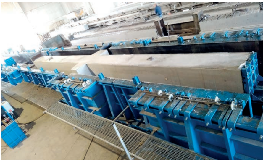
Les poteaux à consoles fabriqués mesurent 28,5 mètres de long.

Créée en 1994 par la famille Pireddu, l'entreprise familiale, qui emploie aujourd'hui 40 personnes, est l'une des plus importantes de la filière sarde du béton préfabriqué. Dans son usine moderne, aménagée sur un espace de 55 000 mètres carrés, la firme produit des structures pour environ quarante projets par an, dont de nombreux bâtiments commerciaux et industriels. Consultecna est un fournisseur de référence et acteur majeur des principales chaînes d'approvisionnement commerciales en Italie comme à l'étranger et, du fait de sa situation géographique centrale, l'entreprise couvre également tout le territoire de la belle île de Sardaigne.