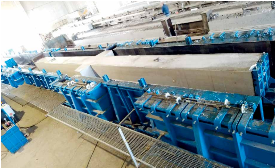
生产的带有托梁的柱子有 28.5 米长

这家家族经营的公司是由 Pireddu 家族于 1994 年创立的，拥有 40 名员工，是 Sardinia 预制行业里最重要的公司之一。这家工厂具有最先进的工艺，占地 5.5 万平方米，每年生产大约 40 种建筑构件——用于商业和工业建筑。Consultecna 不仅是最重要的国内外商业连锁店的参考供应商，而且占领了美丽 Sardinia 的整个地区（也多亏了其中心位置）。