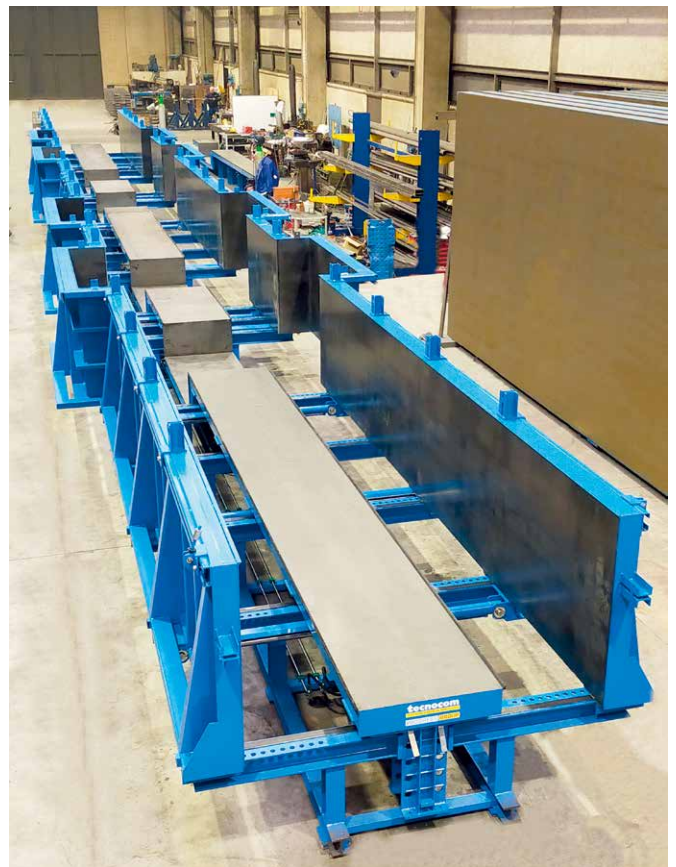
该模具根据 Consultecna 的需要进行个性化设计

Consultecna 能够提供从基础的构件直至外立面以及外立面不同表面的结构解决方案，现在其正在通过自动化生产带有长为 285 米，高和宽长达 100 厘米托梁的支柱来推进其生产。这是一种高度灵活的模具，使用它可以制作最小截面为 30x30 厘米、最大截面为 100x100 厘米、间距为 10 厘米的立柱。所涉及的具体项目是为飞行员建造一个培训中心，这些飞行员不仅仅包括意大利人，还是一个相当重要的项目。