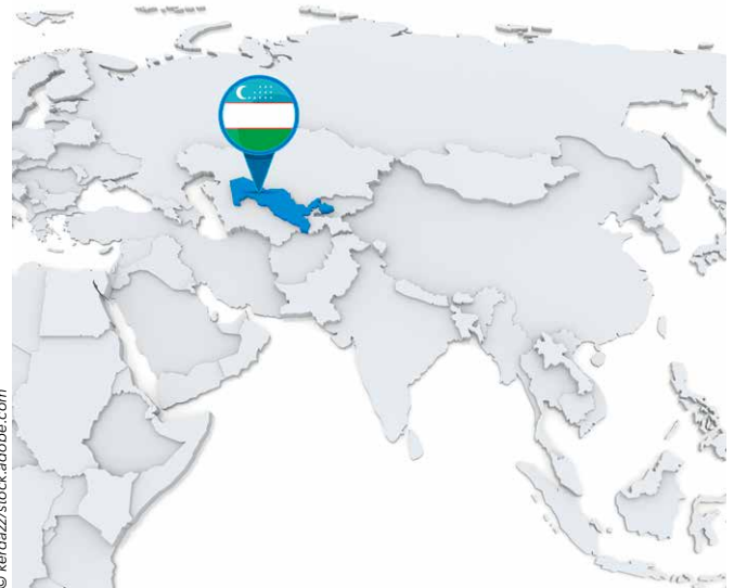
乌兹别克斯坦是一个对投资和商业合作都有吸引力的国家

AKFA 事先进行了多轮内部讨论和决策，因为管理层不想出现任何纰漏。公司研发部的一个业务团队非常高效，他们对市场趋势进行了深入研究，认识到乌兹别克斯坦对多种混凝土产品都有需求。研发部制定了一个很规整的商业计划，其中也考虑到可合作的或者可提供多种产品的供应商。 Masa 不负众望。在 UzBuild 项目之后， AKFA 访问了几家工厂，了解到 Masa 生产工厂的可靠性、技术先进性和高效性。整个工厂参观流程由 Masa 团队组织、安排并全程陪同，这使得 AKFA 确信 Masa 的每个项目经理以及整个团队都具