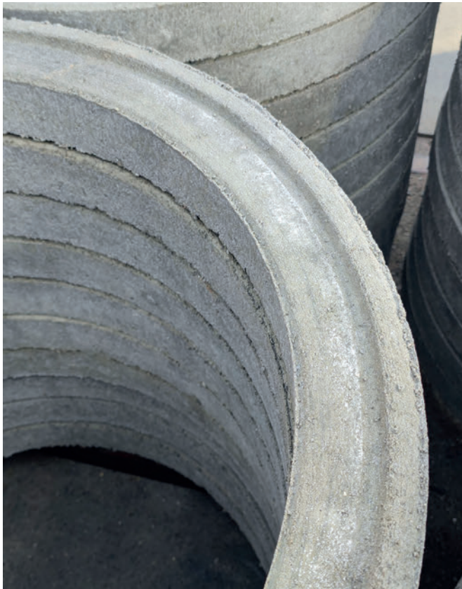
También es posible producir anillos de ajuste con ranura sin encofrados inferiores.