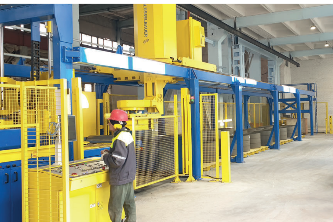
Instalación de producción Ringmaster de Schlüsselbauer Technology durante su uso cotidiano por parte de Kauno Gelžbetonis.

el lugar elegido para instalar y poner en funcionamiento el Ringmaster de Schlüsselbauer Technology con gran rapidez en verano de 2021. Esta instalación lleva produciendo anillos de ajuste con un diámetro de 700 mm y siete alturas desde el primer momento. Una característica única de la producción de estas piezas de hormigón consiste en que se elaboran sin encofrados de acero. Los productos recién elaborados se retiran de la máquina y, acto seguido, se desplazan con cuidado a la zona de endurecimiento utilizando una pinza hidráulica. Al examinar la producción más de cerca, se observa cómo durante este proceso cronometrado de forma óptima, casi al minuto, se transfiere un anillo de refuerzo al molde, se centra de forma hidráulica y, después, se llena el molde con hormigón. La combinación de unidad de vibración, núcleo, molde y prensa permite compactar el hormigón y dar forma a la unión. Además de introducir los anillos de refuerzo ya preparados, el operario de la instalación se ocupa, sobre todo, de supervisar y de controlar que la calidad del hormigón y