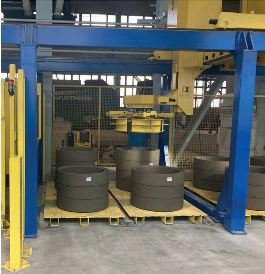
Producción totalmente automática de anillos de ajuste, manipulación mediante el apilador automático Ringmaster.

del producto sea uniforme. Según la altura seleccionada, la instalación Ringmaster alcanza una expulsión de entre 40 y 60 anillos de ajuste redondos por hora.