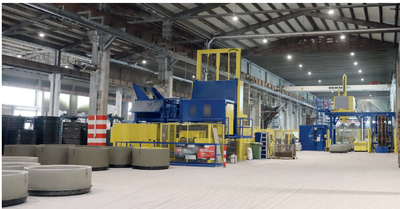
Новая производственная система Magic

Включая новую Magic, на заводе в Золленау теперь работают три системы фирмы Schlüsselbauer Technology. В 1998 году, до приобретения завода компанией Tiba, пре-