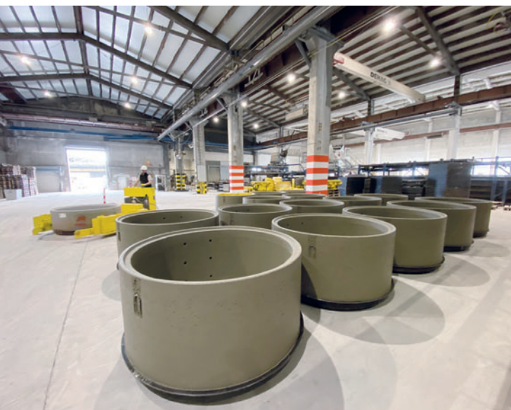
Свежеотформованные изделия в камере выдержки