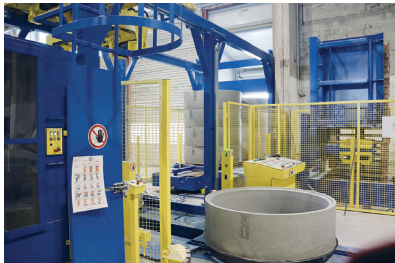
Максимальная высота штабеля - 2 000 мм. В данном случае штабель состоит из четырех колец высотой по 500 мм каждый

Система Magic предлагает две различные концепции: стационарное производство на отдельной производственной машине с ручной транспортировкой продукции или полностью автоматическая циркуляционная установка. На заводе Tiba используется стационарная машина, при этом в зоне готовой продукции уровень автоматизации доведен до максимума: здесь установлена полностью автоматическая система пакетирования паллетов, система очистки и смазки поддонов, а также система автоматического возврата поддонов на производственную линию. Только свежесформованные