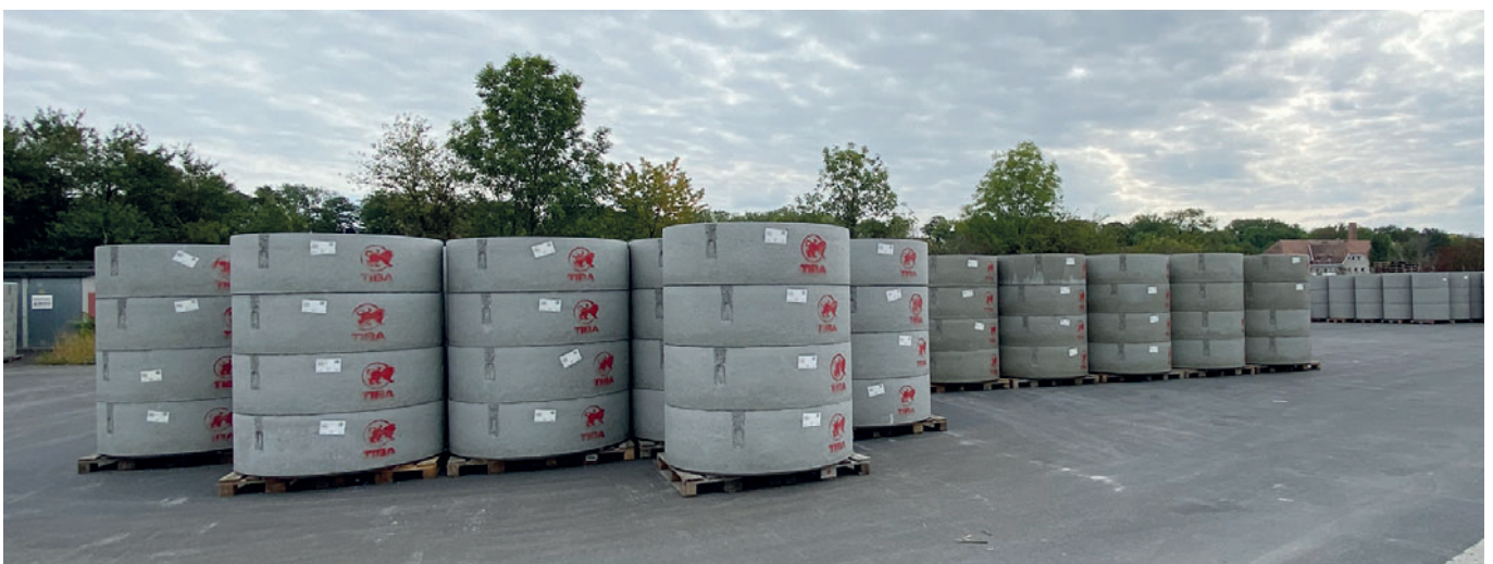
Открытый склад на производстве в Золлену

Если для изделия требуются встроенные маршевые скобы, оператор во время процесса заполнения формы или виброуплотнения помещает скобы в специальный магазин запатентованной системы Stepmaster от