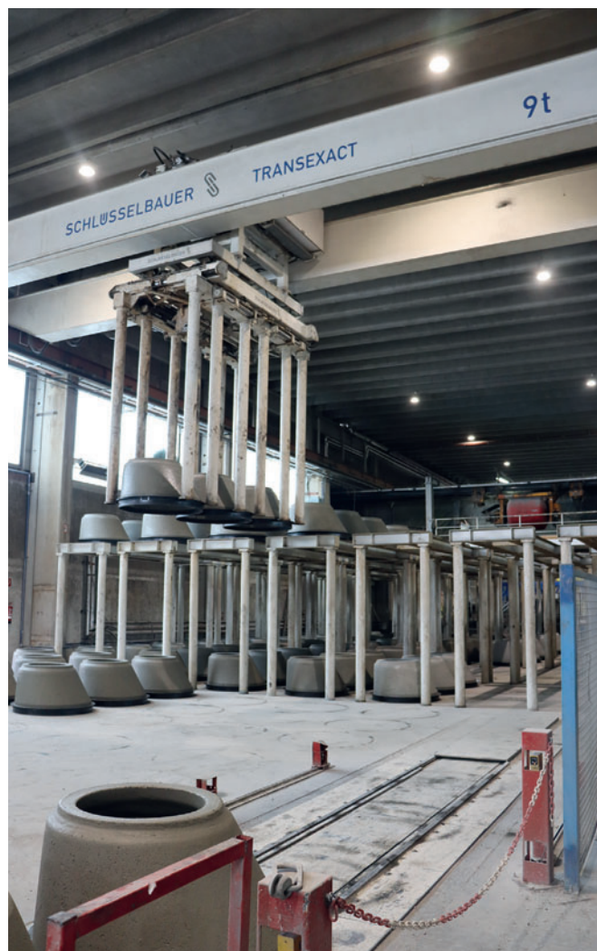
Модульная, полностью автоматизированная система Exact для производства труб и элементов бетонных колец с дном успешно используется на заводе в Золленау с 1998 года

Schlüsselbauer. Затем магазин Stepmaster с помощью программного управления перемещается в позицию ожидания, а в процессе распалубки скобы переносятся в сердечник и затем автоматически вставляются в следующий элемент, при этом время производственного цикла не увеличивается, а простои исключаются. Stepmaster может установить также и гильзы для перфорации, чтобы впоследствии в гильзы можно было врезать приспособления для подъема.