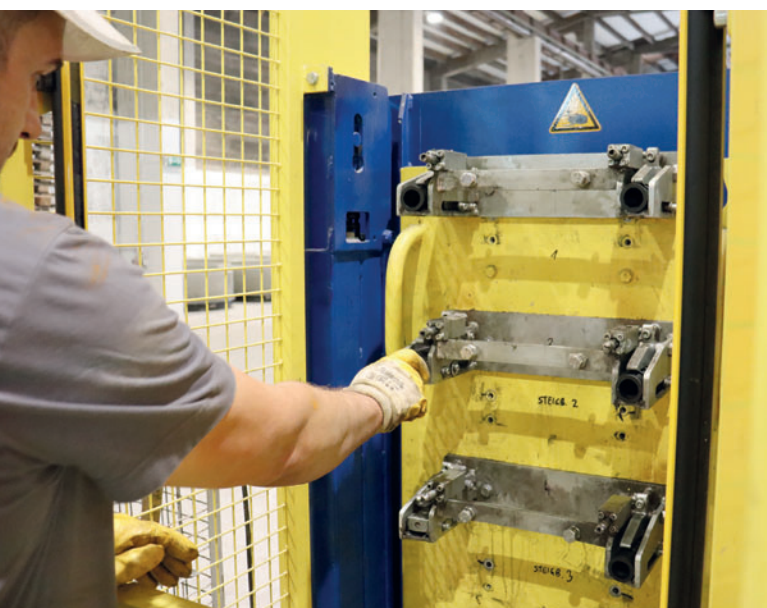
Вставка гильз для дополнительных подъемных приспособлений в магазин Stepmaster

Производственная система Magic от Schlüsselbauer Technology предназначена для изготовления методом вибропрессования компонентов бетонных колец с днищем для проектов гражданского строительства, таких как доборные кольца и эксцентриковые конусы высотой до 1200 мм. Существует две версии системы Magic: Magic 1501 и Magic 2500, причем последняя подходит для производства крупноформатных колец. Компания Tiba выбрала производственную систему Magic 1501, которая