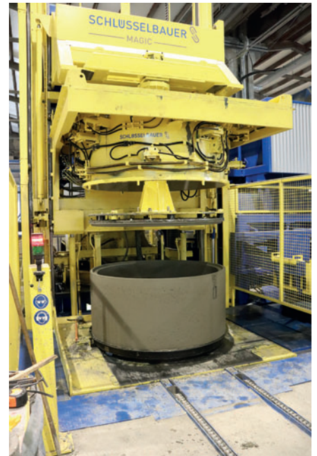
Заполнение системы Magic бетоном. Процессы виброуплотнения и выгрузки готового продукта полностью автоматизированы

дыущий владелец использовал установку Schlüsselbauer Exact, которая представляет собой модульную, полностью автоматическую систему производства труб и компонентов бетонных колец с днищем. В 2013 году компания Tiba установила систему производства оснований бетонных колец Perfect от компании Schlüsselbauer, которая позволяет производить элементы за одну заливку с использованием технологии вибролитья. В целом, корпоративная группа Kirchdorfer Fertigteilholding эксплуатирует десять систем Schlüsselbauer Technology на пяти производственных площадках.