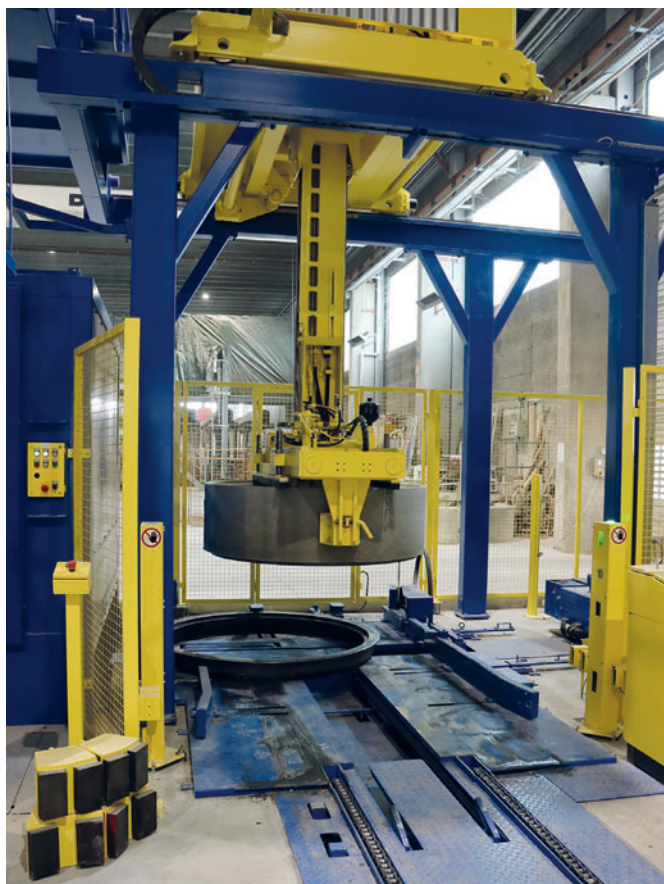
После снятия изделия с поддона последний транспортируется непосредственно на станцию автоматической очистки

ночном производстве. Квадратные профили могут быть изготовлены с внешними размерами до 1270 x 1270 мм при одиночном производстве.