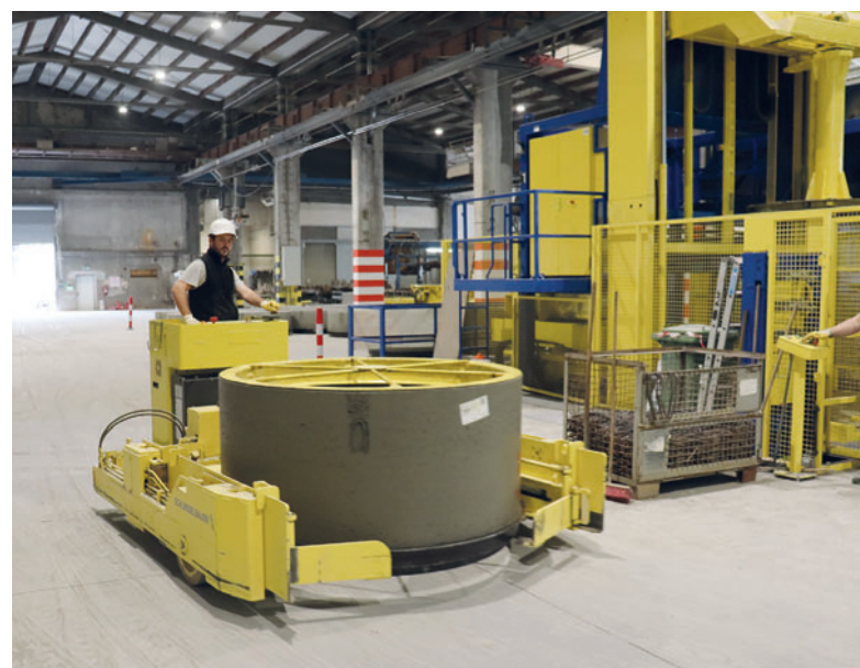
Электрическая тележка для транспортировки свежетоформованных и отвержденных изделий