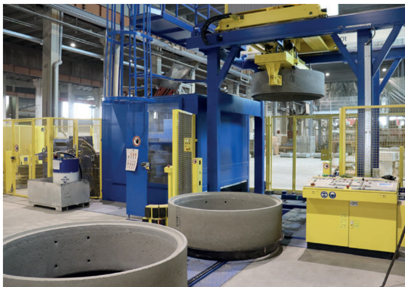
Станция пакетирования, прилегающая станция очистки поддонов

позволяет одновременно изготавливать до шести сборных железобетонных элементов и рассчитана на максимальный размер изделий до 820 мм наружного диаметра при двойном производстве и до 1800 мм - при оди-