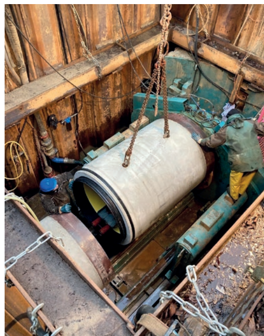
W projektach przeciskowych dostępna przestrzeń jest bardzo ograniczona. Dzięki systemowi Perfect Pipe zabezpieczony przed korozją rurociąg jest kompletny zaraz po przyłączeniu kolejnej rury.

wysokiej jakości rury betonowe coraz częściej przekonują solidnością wykonania.