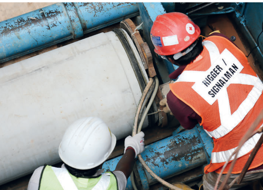
Instalación de tubos para hincado Perfect Pipe en el primer proyecto de ese tipo en Singapur. Se informó al respecto ya en el PHi 2/2016.