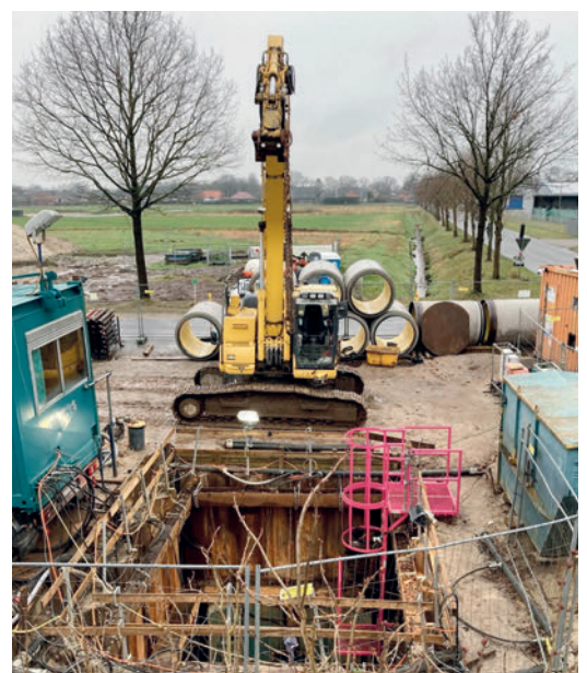
Típico almacén de Perfect Pipe en obra (Haren, Alemania). En 2021 se introdujeron a presión por vez primera en Alemania tubos para hincado Perfect Pipe con DN 1200.