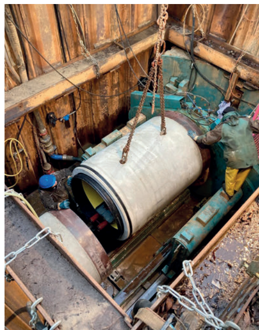
En el hincado de tubos, por lo general, suele haber poco espacio. Por ello, la ventaja que ofrece la Perfect Jacking Pipe, que crea un sistema de tuberías completo y totalmente protegido contra la corrosión al introducir el tubo siguiente, reviste incluso mayor importancia.

a la situación desarrollando y mejorando de forma constante este tipo de molde en concreto. Sus tubos producidos por endurecimiento con encofrado, con una calidad uniforme desde el extremo hasta el manguito, han sustituido en gran medida a los productos vaciados en seco para el hincado de tubos. También en comparación directa con otros materiales se prefieren cada vez más tubos de hormigón que sean resistentes y, al mismo tiempo, de alta calidad.