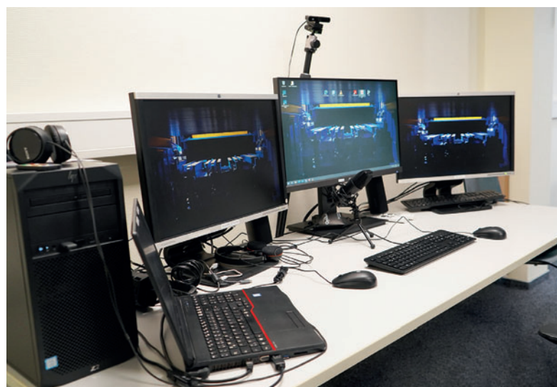
В начале марта 2021 года состоялось торжественное открытие нового помещения с профессиональным техническим оборудованием и звукопоглощающими стенами