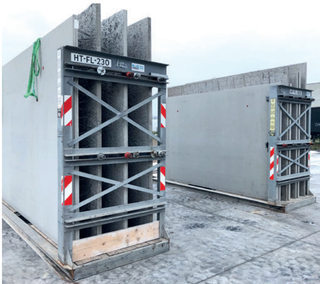
Двойные стеновые панели подготовлены к транспортировке на стройплощадку

Доминик Циде очень доволен новым производственным предприятием: «Мы очень тесно сотрудничали с нашим поставщиком. Компания Progress доказала высокий уровень эффективности. Она разработала инновационный производственный процесс, отвечающий всем нашим потребностям. Скорость реагирования на наши запросы определенно сыграла решающую роль».