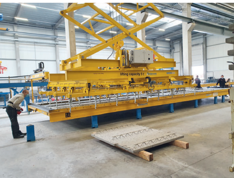
Распалубочный кран гарантирует безопасное извлечение элементов