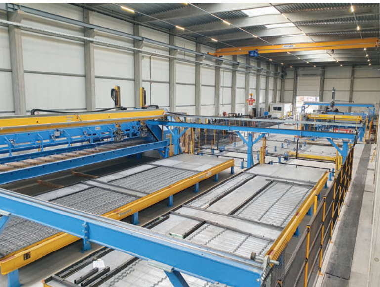
Детализированный вид завода с автоматическими модулями обработки арматурной проволоки, а также полностью автоматическим опалубочным роботом, включая устройство для очистки поддонов