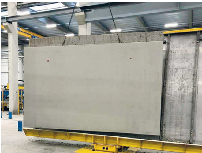
Производство первых двойных стеновых панелей