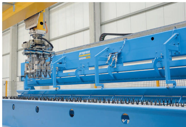
Арматурный центр Wire Center полностью автоматически укладывает арматуру, повышая выработку