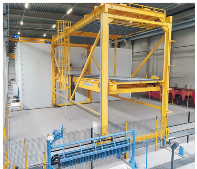
Полностью автоматизированный штабелеукладчик поддонов для укладки и разборки штабелей поддонов под управлением системы ebos®

ства, работы идут хорошо. Г-н Циде оказывает проектную поддержку по строительству нового завода по производству сборных железобетонных элементов в Алсте. В его задачи входили подбор поставщиков и подрядчиков, подготовка и контроль работ на объекте, ввод в эксплуатацию и запуск завода. Новая производственная площадка функционирует на полную мощность, обеспечивая быстрое время реагирования и оперативный выпуск стандартных изделий для строительного рынка. Завод обслуживает как мелких подрядчиков, которые строят небольшие квартиры, до крупных строительных фирм на самом высоком уровне, которые занимаются возведением офисных зданий или крытых парковок.