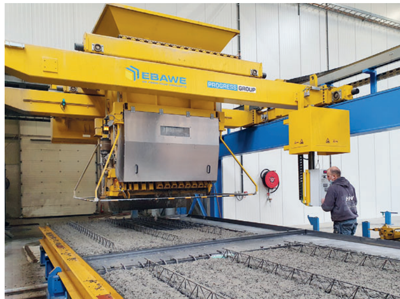
Бетонораздатчик распределяет бетонную смесь по поддонам с уложенной арматурой, изготовленной по индивидуальному заказу