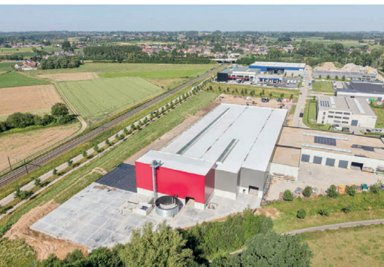
Новое производственное предприятие в Алсте полностью готово к работе и оборудовано по последнему слову техники

По словам Доминика Циде, ответственного менеджера D-Beton, текущая рыночная ситуация на данный момент достаточно хорошая, у компании нет проблем с заказами, и производственные площадки полностью загружены. Даже если это сложно оценить, учитывая обстоятель-