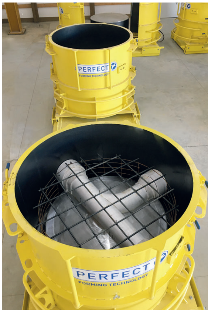
Perfect Forming Technology – этот термин означает литейные формы для производства высококачественных бетонных элементов, которые постоянно оптимизируются компанией Schlüsselbauer Technology

мм) производятся ежедневно с использованием новой технологии производства. Типичная высота составляет 4 фута (1219 мм), а наиболее распространенные трубопроводные соединения – от 6 до 20 дюймов (от 152 до 508 мм). Чтобы соответствовать различным проектным требованиям, кольца с днищем могут быть при необходимости снабжены защитой от всплывания по окружности. Формы для этого могут быть при желании адаптированы соответствующим образом. Затвердевшие конструктивные элементы распалубливаются на следующий рабочий день с помощью поворотного захватного устройства с гидравлическим зажимом. Это увеличивает эффективность и безопасность производства.