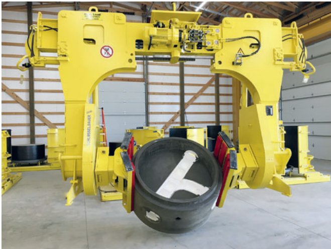
Precast Supply использует гидравлический поворотный захват для снятия изоляции и поворота элементов