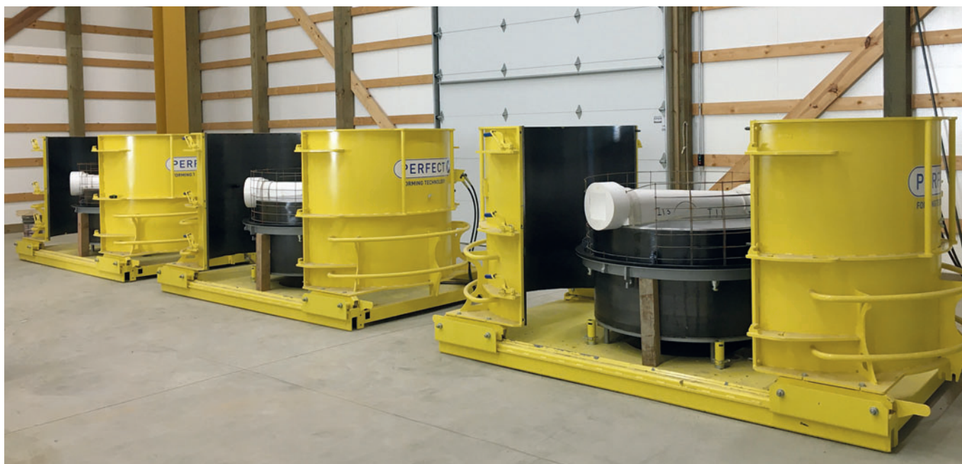
Формы, оборудованные формообразующими вкладышами для водоводов и стальной арматурой, готовы к заполнению самоуплотняющимся бетоном

Компания Precast Supply исторически занималась производством профилей для водоводов в смотровых колодцах. Таким образом, несмотря на различные характеристики изделий, например подводящие каналы, суть требований к производственной системе Perfect определить довольно легко. В тесном сотрудничестве со специалистами Schlüsselbauer Technology в головном офисе в Австрии и в американской компании в Нэшвилле, штат