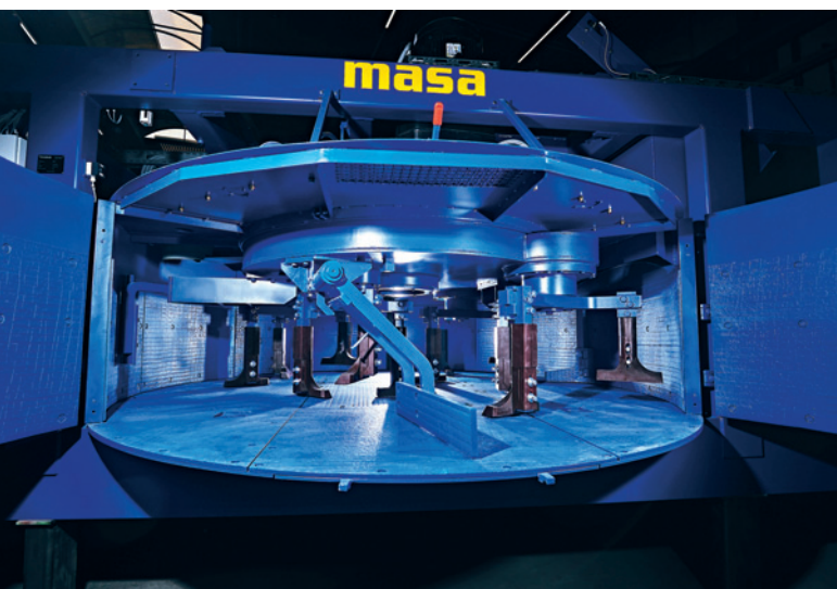
Masa PH 3000/4500.

Podczas rozmów i negocjacji z różnymi dostawcami mieszarek do betonu stopniowo krystalizowało się przekonanie, że najlepszym partnerem do tego zadania będzie firma Masa. Ważną rolę w procesie decyzyjnym odegrała, oprócz wielu szczegółów technicznych, masywna i solidna konstrukcja mieszarki Masa. Model PH 3000/4500, zbudowany z dolnej i górnej ramy oraz mieszalnika z dwiema parami dwuskrzydłowych drzwi otwierających się aż do dna, waży prawie 25 ton i jest tym samym znacznie cięższy niż modele oferowane przez konkurencję. Znacznie większa ilość użytej stali, a także wyposażenie przekładni planetarnej w trzy zewnętrzne silniki o mocy 45 kW i klasie wydajności energetycznej IE3, dają się wyraźnie zauważyć. Mieszarka Masa oferuje kombinację jak najkrótszych cykli mieszania z minimalnym zużyciem i bardzo wysoką dostępność urządzenia.