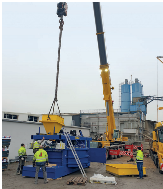
Nowe wyposażenie dla Jasto.

Stającą wysoką jakość swoich wyrobów firma Jasto gwarantuje dzięki liniom technologicznym spełniającym bardzo wysokie standardy techniczne. Ściśle ukierunkowane inwestycje i modernizacje zakładu w Ochtendung stanowią gwarancję tego, że firma Jasto we wszystkich swoich segmentach wykorzystuje do produkcji najnowsze technologie, zapewniające imponującą precyzję i bardzo dużą wydajność produkcji. Uruchomiona w 2017 r. wibroprasa Masa do produkcji wyrobów wykorzystywanych w ogrodnictwie pracuje z maksymalną prędkością, tak samo jak zamontowana w 2014 r. wibroprasa Masa do produkcji bloczków murowych. W 2019 r. firma Jasto zdecydowała się zmodernizować tę linię technologiczną. Przeszła mieszarka do betonu konstrukcyjnego miała zostać zastąpiona nowoczesnym sprzętem o wysokiej energii mieszania, umożliwiającym bezproblemową i elastyczną produkcję całego spektrum wymaganych mieszanek betonowych.