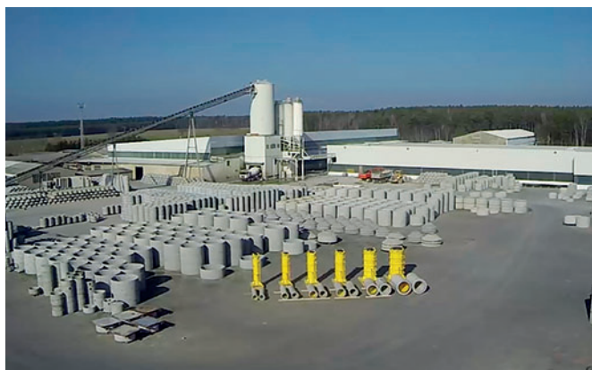
Presentación de los tubos compuestos de plástico y hormigón Perfect Pipe en las instalaciones de Grafe Beton en Stölpchen, Dresde, Alemania.

Si la capacidad productiva es superior a la demanda real, es posible conmutar la producción a otro tipo de componente en un plazo de media hora. Esto resulta de gran utilidad para reaccionar a tiempo según las oscilaciones de las cantidades necesarias, así como para evitar producir cantidades adicionales de componentes menos demandados. Además de sustituirse los moldes externos, los núcleos también se pueden