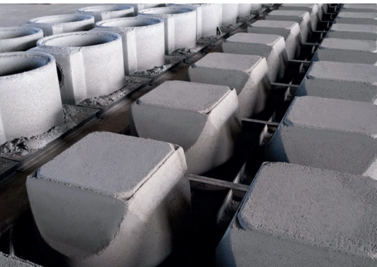
Los productos en la zona de endurecimiento de la nave de producción de Grafe Beton.

endurecimiento tiene lugar mediante carros eléctricos. Estos carros, también de Schlüsselbauer Technology, permiten maniobrar de forma rápida y delicada, además de colocar los productos ahorrando espacio. Si los desagües no están dotados de elementos integrados que deba preparar el trabajador de forma constante en la máquina, solo hace falta un empleado para toda la producción, incluso para el procedimiento de los componentes en la zona de endurecimiento. El proceso de producción de la máquina tiene lugar de forma completamente automatizada y sin intervención por parte del operario.