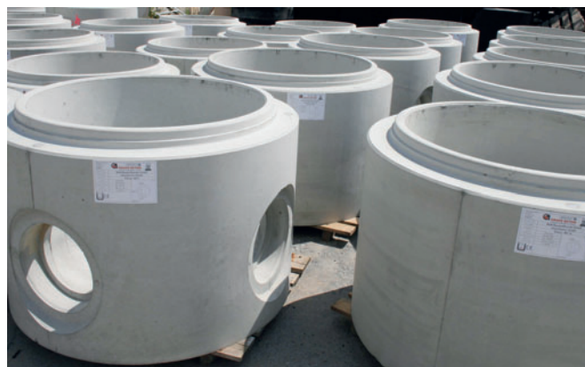
Bases para pozos de hormigón monolíticas Perfect producidas de una pieza: producción a medida con la eficiencia de un proceso de fabricación industrial.

Además de sus inversiones en garantía de calidad y aumento de las capacidades de su programa ya establecido de canales de desagüe y anillos de pozos, Grafe Beton apuesta con de-