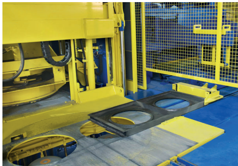
Alimentación automática de los manguitos en la instalación de producción.

convertir en poco tiempo al siguiente tipo de desagüe. Junto a la producción de canales de desagüe, clave para decidirse a invertir, la instalación Magic que opera Grafe Beton puede producir opcionalmente en el modo individual elementos de pozos DN1000 con una altura de hasta 1000 mm.