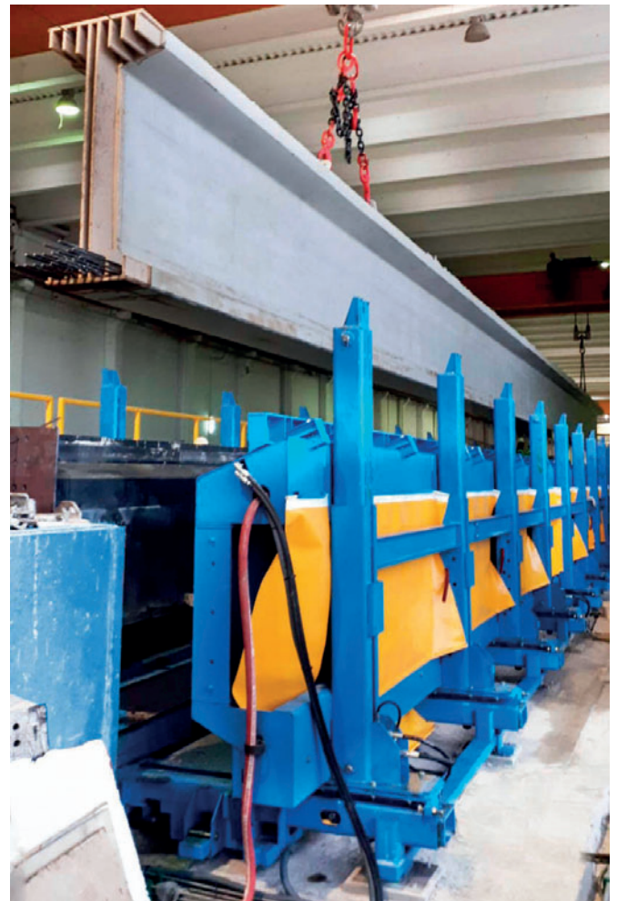
Entnahme des betonierten Trägers aus der variablen Schalung mit individuell anpassbaren Abschnitten.