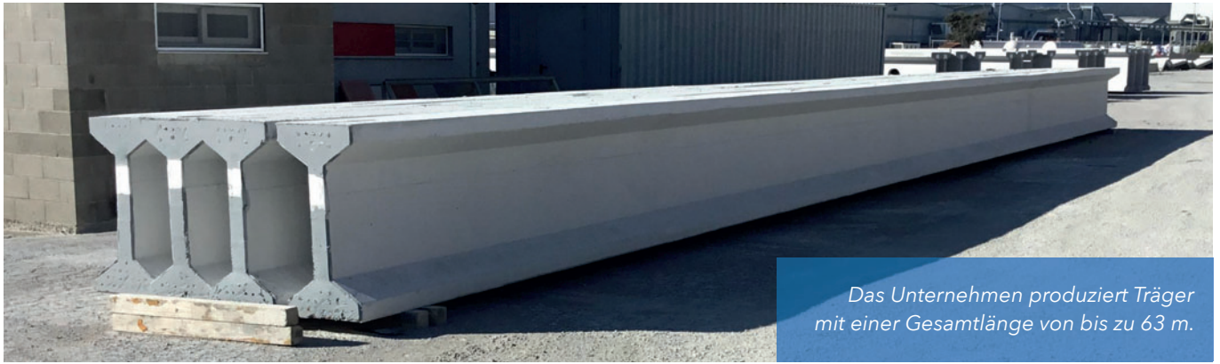
Das Unternehmen produziert Träger mit einer Gesamtlänge von bis zu 63 m.

Die Zielsetzung des Unternehmens bestand darin, in eine automatische und hochflexible Anlage zu investieren, mit der Träger unterschiedlicher Größen hergestellt werden können. Konkret handelt es sich hierbei um eine imposante Schalung für die Herstellung von Trägern mit individuell anpassbaren Abschnitten auf einer Gesamtlänge von 63 m. Diese spezielle Schalung stellt eine geeignete Lösung für die hohen Anforderungen eines führenden Unternehmens wie Hormipresa dar, um die flexible Produktion von Betonfertigteilen für zahlreiche Wohn- und Industriegebäude auch in Zukunft bestmöglich abdecken zu können.