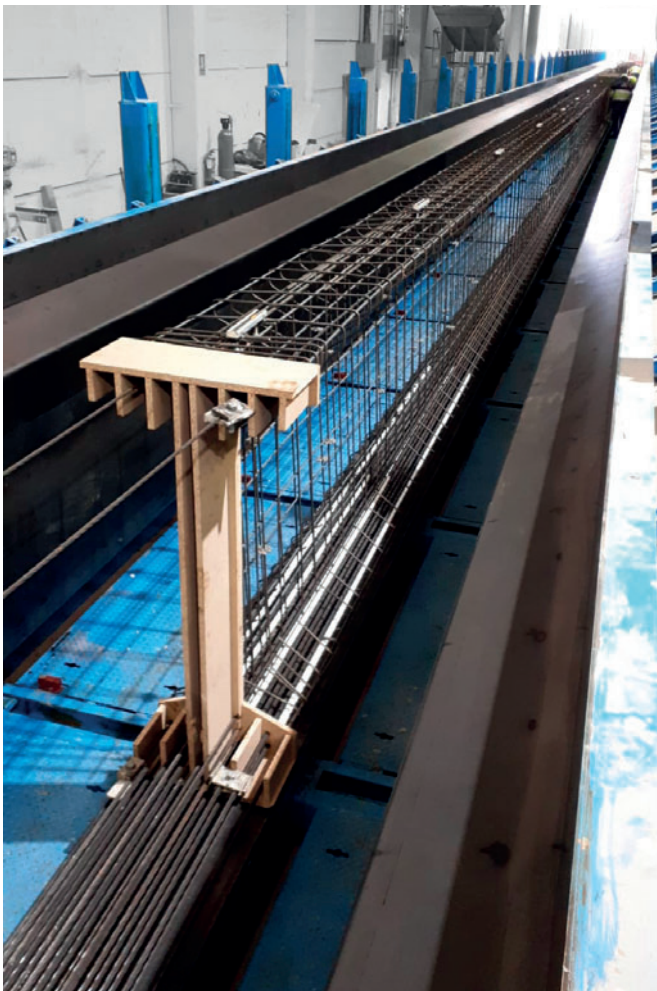
Die sehr flexible und automatische Schalung zur Herstellung von Trägern wurde speziell für Hormipresa konstruiert.

Der Produktionsstandort von Hormipresa in Katalonien ist hauptsächlich auf die Produktion von Elementen für große vorgefertigte Industriegebäude ausgerichtet.