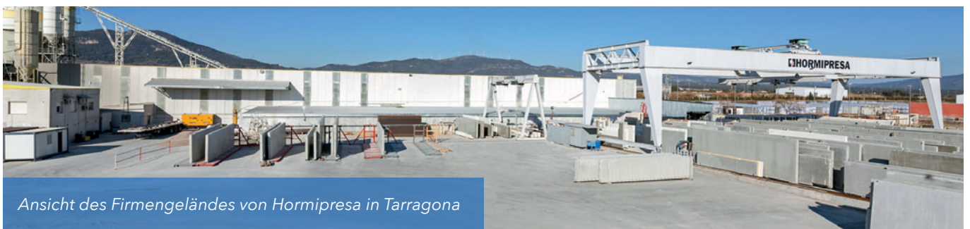
Ansicht des Firmengeländes von Hormipresa in Tarragona

Hormipresa-Produkte bieten sehr hohe Tragfähigkeiten in Verbindung mit beachtlichen Spannweiten. Das Unternehmen zeigt sich mit der aktuellen Marktsituation zufrieden und ist bereit, sich zukünftigen Herausforderungen zu stellen: „Basierend auf den laufenden Bestellungen arbeiten wir in diesem Jahr mit 75 % unseres Potenzials, aber die Vorzeichen stehen gut, um in naher Zukunft 100 % zu erreichen. Ein wichtiger Baustein dafür ist die positive Zusammenarbeit mit Tecnom, das Hormipresa mit seinen Erfahrungen im Bau von individuell zugeschnittenen Maschinen als zuverlässiger Partner unterstützt und damit die Produktionsabläufe so effizient wie möglich gestaltet. Die hohe Anzahl eingehender Bestellungen und die fortwährende Kundenzufriedenheit unterstreichen die Sinnhaftigkeit dieser Investition und sind Grundlage für eine weiterhin erfolgreiche Partnerschaft.“