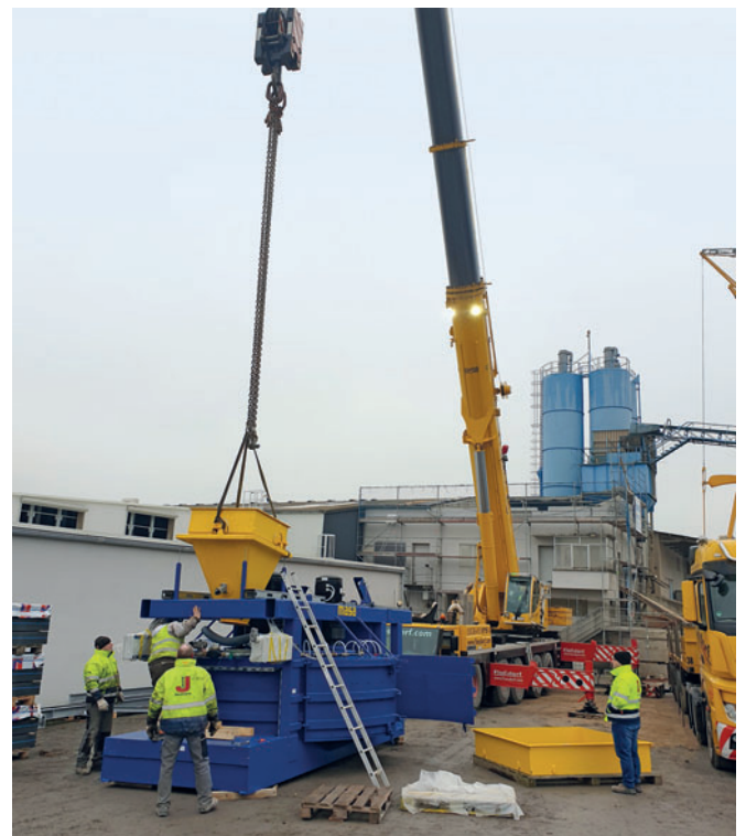
Neues Equipment für Jasto

Eine gleichbleibend hohe Qualität stellt Jasto durch Produktionsanlagen sicher, die einem sehr hohen technischen Standard entsprechen. Zielgerichtete Erweiterungen und Modernisierungen des Werkes in Ochtendung sind der Garant dafür, dass sich Jasto in allen Produktbereichen mit fortschrittlicher Technologie am Markt behauptet und mit beeindruckender Maßgenauigkeit sowie sehr hohen Kapazitäten fertigt. Die 2017 in Betrieb genommene Masa-Steinfertigungsmaschine für Gartenwelt-Produkte läuft ebenso wie die 2014 installierte Masa-Steinfertigungsmaschine für Wandbaustoffe auf Hochtouren. 2019 entschließt sich Jasto zu einer Modernisierungsmaßnahme innerhalb dieser Anlage. Die in die Jahre gekommenen Kernbetonmischer sollten durch modernes Hochleistungsequipment ergänzt werden, das die gesamte Bandbreite der erforderlichen Mischungen problemlos und flexibel produzieren kann.