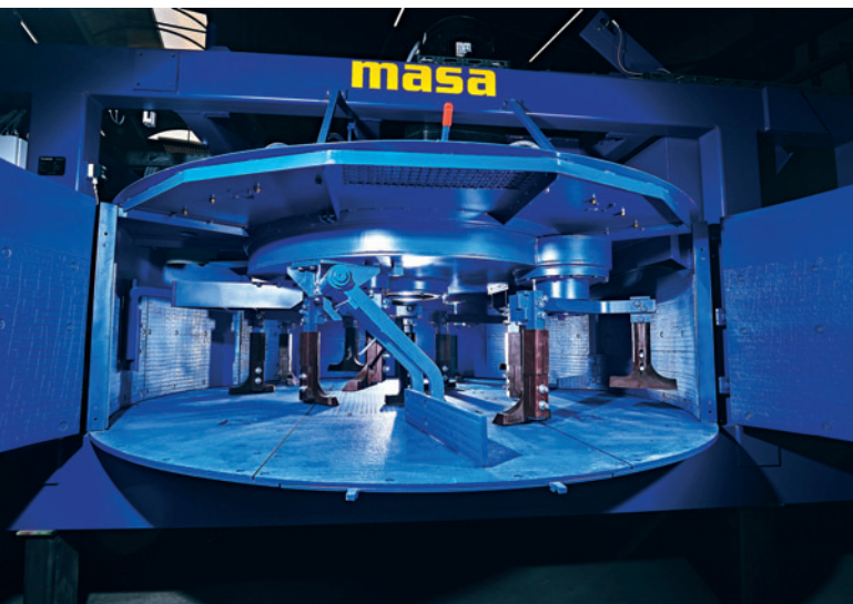
Masa PH 3000/4500

In den Gesprächen und Verhandlungen mit verschiedenen Anbietern von Betonmischern kristallisierte sich nach und nach heraus, dass Masa der richtige Partner für diese Aufgabe ist. Eine wichtige Rolle bei der Entscheidung spielte, neben vielen technischen Feinheiten, auch die massive und solide Bauweise des Masa-Betonmischers: Der PH 3000/4500, bestehend aus Unter- und Oberrahmen sowie Mischtrug mit je zwei sich bis zum Boden öffnenden Doppelflügel-Türen, bringt mit knapp 25 t Gesamtgewicht bedeutend mehr auf die Waage als viele seiner Mitstreiter. Das deutliche Mehr an verbautem Stahl sowie die Ausstattung des Planetengetriebes mit drei außen liegenden 45-kW-Antriebsmotoren der Energieeffizienzklasse IE3 machen sich bemerkbar: Der Masa-Mischer liefert eine Kombination aus möglichst kurzen Mischzyklen bei geringem Verschleiß und einer sehr hohen Anlagenverfügbarkeit.