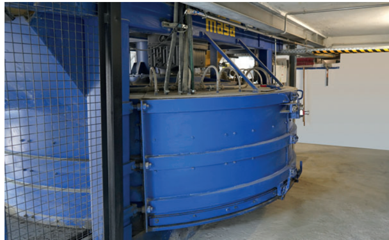
Erfolgreiche Installation des neuen Mixers

Aufgrund der räumlichen Gegebenheiten wird bei Jasto das Mischgut über ein Dosierband und einem daran anschließenden Zwischensilo eingefüllt. Das Silo mit motorischer Klappe dient der Pufferung des Mischguts. Zur Pufferung einer Mischung sowie zur Übergabe an das nachfolgende Betontransportband ist unterhalb des Mischerauslaufs eine Übergabeschurre installiert.