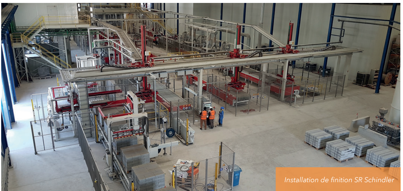
Installation de finition SR Schindler

Ainsi, la centrale à béton de Hess - qui est parfaitement adaptée aux besoins de Raknor - et l'installation de production de blocs de béton avec la machine centrale RH 2000-3MVA disposent de toutes les fonctionnalités pour produire des blocs de béton de qualité absolument supérieure.