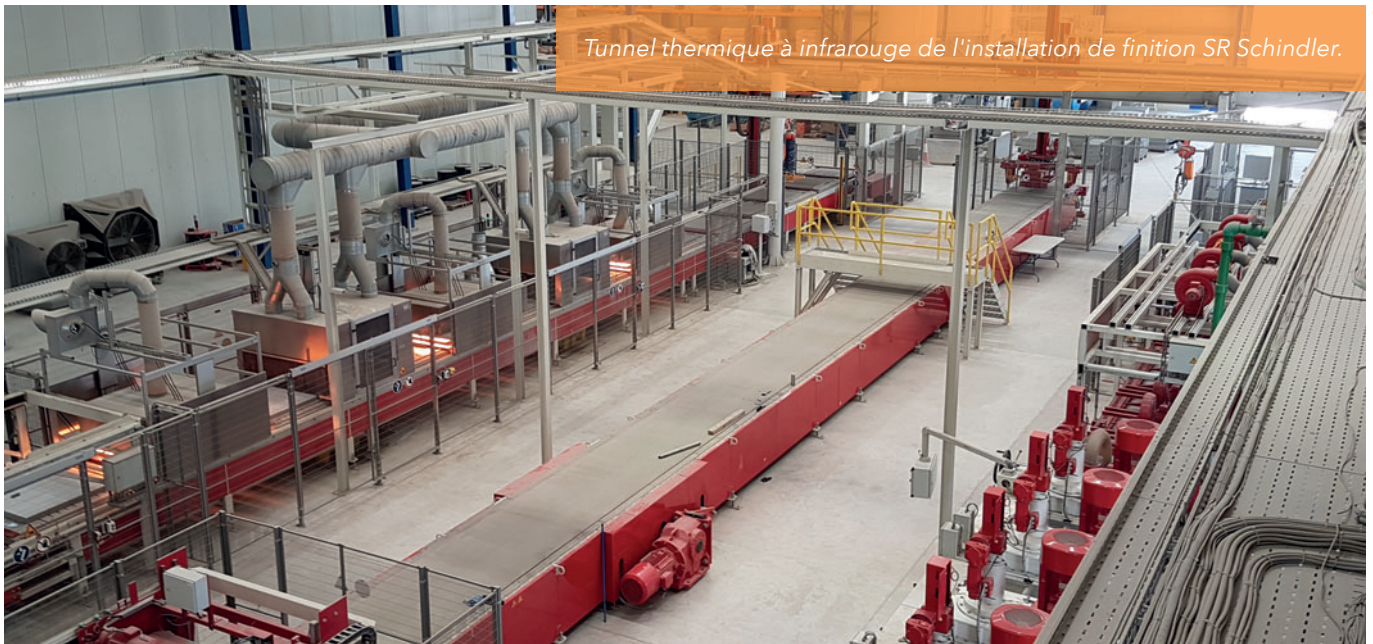
Tunnel thermique à infrarouge de l'installation de finition SR Schindler.

Le client Raknor a décidé de conclure un partenariat avec un fabricant allemand de renom, afin de bénéficier de son « savoir-faire » pour la sélection des granulats et la production de produits en béton de haute qualité. Les opérateurs de machines ont par exemple déjà été formés dans l'usine allemande dudit partenaire pendant la période d'installation de l'usine aux Émirats arabes unis.