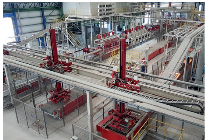
Technologie de manutention SR Schindler « Made in Germany »

Ce projet prestigieux a débuté avec la vision de Raknor d'être l'une des premières entreprises de la région à produire et à commercialiser des dalles de grand format pour se différencier de la concurrence et développer de nouveaux marchés. Dans le cadre de la recherche d'idées pour des produits en béton de haute qualité, Raknor a visité plusieurs usines en Europe afin de découvrir les équipements et les produits qui y sont installés. En collaboration avec les spécialistes de Raknor, Hess et SR Schindler ont ensuite développé et mis en œuvre un concept global qui répond au mieux aux attentes ambitieuses de tous les intervenants concernés en matière de productivité et de qualité de produit réalisable.