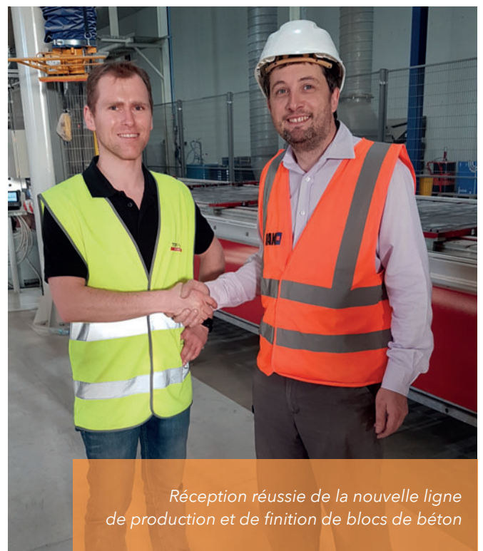
Réception réussie de la nouvelle ligne de production et de finition de blocs de béton