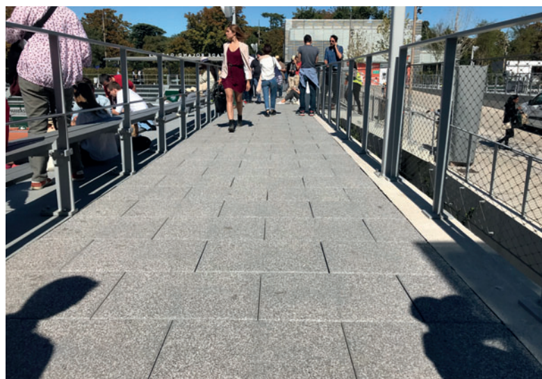
Colocación en la zona peatonal