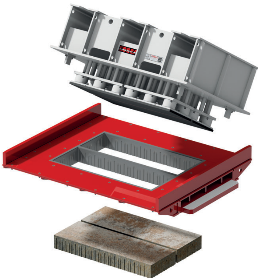
Molde de bloque de hormigón Boltline 1 con producto

El recinto del Estadio Roland Garros se ampliará posteriormente otras 2,5 ha. «El proyecto aún se encuentra en fase de construcción y no finalizará hasta 2021. Hasta el momento ya hemos suministrado más de 10.000 m 2 de adoquines de grandes formatos. Además, producimos otros productos de hormigón como, por ejemplo, bordillos para árboles con un diseño y características adaptados a nuestras placas de hormigón. Todas las zonas peatonales y de tránsito, incluyendo los aparcamientos, se equiparon con nuestros productos. Esto nos enorgullece. Este proyecto ha representado un importante desafío y nos ha exigido mucho desde el punto de vista técnico. Gracias a nuestros conocimientos, así como también a los de nuestras empresas asociadas, hemos podido desarrollar y fabricar el mejor producto posible para contribuir al nuevo diseño de este complejo de tenis de enorme tradición».