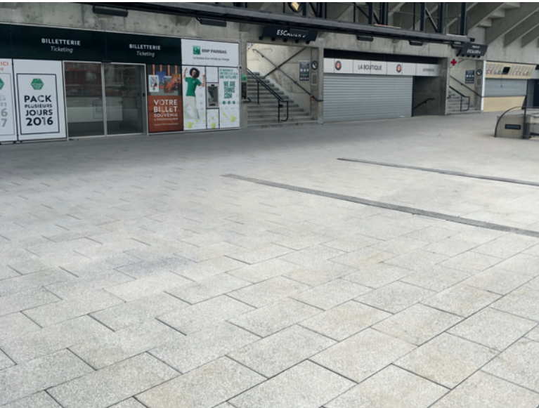
Colocación en la zona de entrada

10, 12 y 14 cm, que fabricamos en una producción de prueba. Tras la revisión y el estudio de las primeras muestras de bloques de hormigón por parte de los tomadores de decisiones se realizaron más de 50 ensayos adicionales en los que fue posible llevar a la práctica exitosamente todas las especificaciones relacionadas con dimensiones de los bloques, superficies, colores y propiedades técnicas».