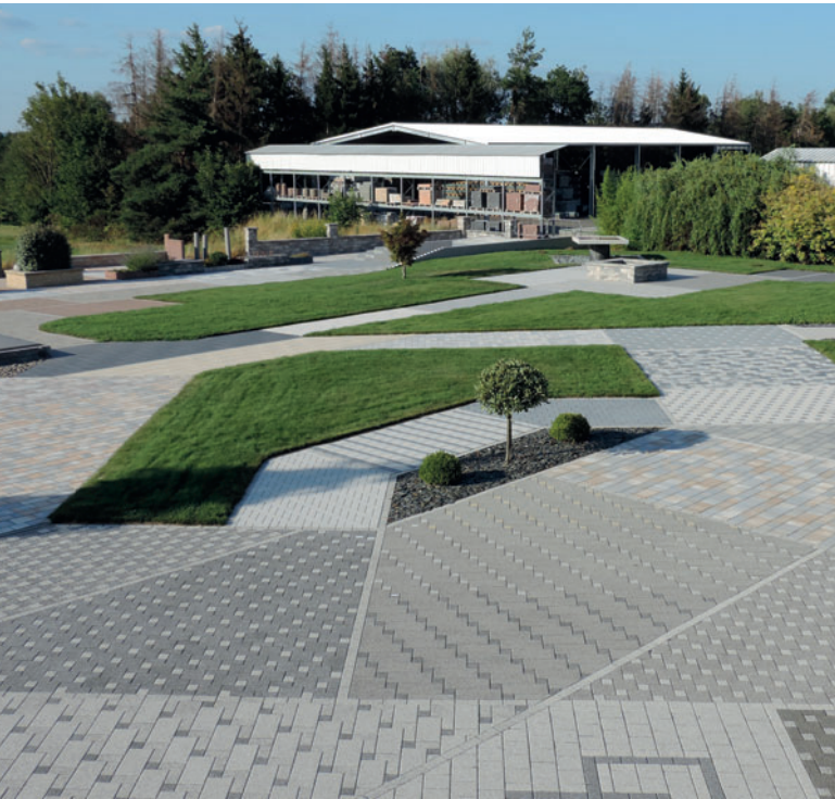
Jardín de bloques Heinrich & Bock