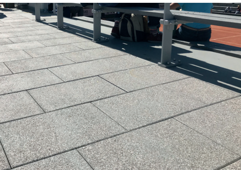
Vista detallada de las placas de hormigón

El proceso de licitación para este proyecto de grandes dimensiones fue largo y exigente. Patrick Heinrich explica algunas particularidades y condiciones específicas: «En una primera fase debía rediseñarse la zona exterior de la pista Suzanne Lenglen, en la cual, antes de la modernización, se contaba con piedra natural. Esta continuó siendo la preferencia de los arquitectos responsables. No obstante, en comparación, los bloques de hormigón ofrecen la ventaja de que pueden garantizar siempre una fórmula idéntica y por tanto una calidad elevada y constante. Además, podemos dotar a nuestros productos de características técnicas relacionadas, por ejemplo, con el acabado superficial o una protección óptima contra desplazamiento. Por esta razón, desde un comienzo tuvimos claro que había que dar preferencia a los bloques de hormigón frente a otros materiales de construcción. En la fase de desarrollo, una piedra natural de la instalación nos sirvió de muestra. Se requerían diferentes alturas de bloque de 8,