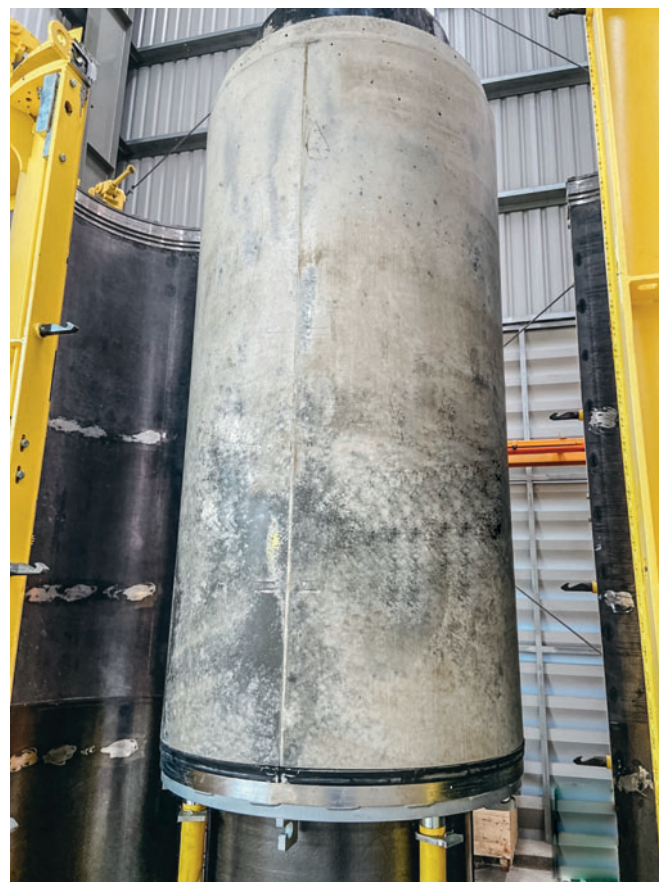
Tuyau de fonçage Perfect - durci moule, prêt en seulement quelques heures

résulte directement une conduite étanche et opérationnelle. C'est d'autant plus important dans les activités de fonçage : les travaux de soudure supplémentaires sur site effectués au niveau de conduites déjà posées engendrent une charge de travail considérable et nécessitent la mise en place de mesures de sécurité, constituant ainsi un énorme facteur de coûts.