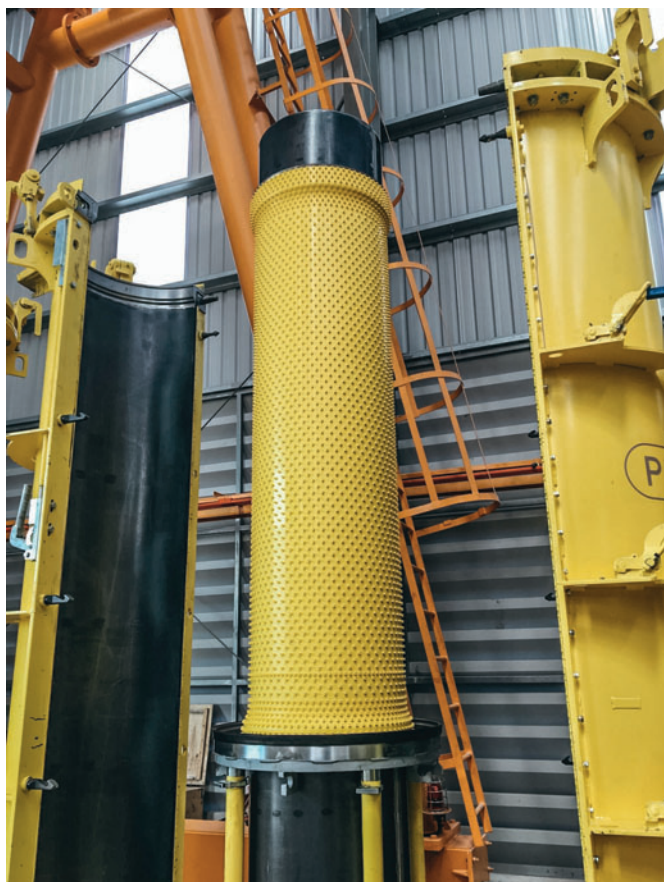
Le revêtement Perfect est enfilé sur le noyau rétractable.