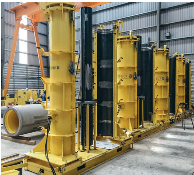
Les moules de la gamme Perfect Forming Technology de Schlüsselbauer sont faciles à utiliser et désormais intégrés à la ligne de production de l'entreprise Phnom Penh Precast au Cambodge

Les dimensions les plus courantes des robustes tuyaux utilisés actuellement sur le marché du génie civil au Cambodge pour la pose sans excavation (microtunnel) vont du diamètre 300 au 700. Selon les demandes des chantiers les tuyaux peuvent être fabriqués en longueur 2 ou 3 m. Pour ce faire la longueur nécessaire de revêtement intérieur PEHD est découpée à partir d'un gros rouleau, puis soudée pour former un cylindre. Afin de pouvoir ajouter ultérieurement au tuyau un emboîtement flexible, les deux extrémités du cylindre sont formées par procédé thermoplastique. Dans la niche ainsi formée on intègre un manchon en plastique (« connecteur ») qui permet, à l'aide de deux joints extérieurs, d'assurer une étanchéité fiable à l'intérieur comme à l'extérieur. Grâce à ce procédé il n'est nul besoin de souder les tuyaux sur le chantier, car comme ceux-ci sont assemblés à l'aide de connecteurs, il en