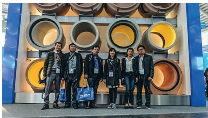
La délégation représentant l'entreprise Phnom Penh Precast lors de la Bauma 2019

« Go for the Best » et « The strength to drive it through » sont les mantras de la stratégie d'innovation de Phnom Penh Precast. « Imposer la perfection » exige d'un côté le savoir-faire nécessaire dans les différents domaines d'activité de l'entreprise, et d'un autre côté de faire preuve de volonté et de détermination pour convaincre les partenaires de la chaîne logistique du génie civil des avantages des innovations et de l'intérêt de renoncer à des pratiques traditionnelles devenues archaïques. La force d'innovation qu'affiche ostensiblement Phnom Penh Precast combine ces deux aspects. Et le rôle d'entrepreneur de Phnom Penh Precast au