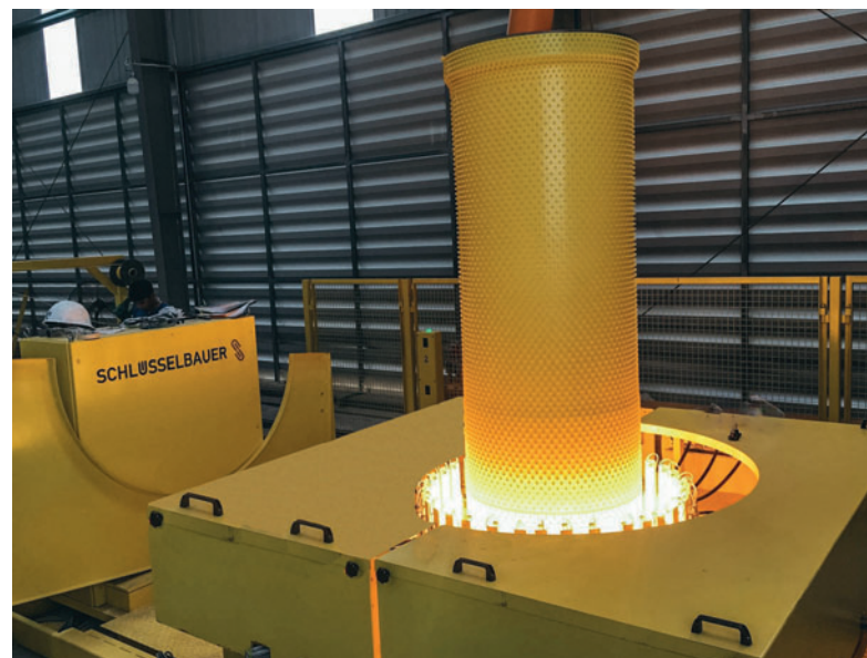
Le procédé thermoplastique permet de finaliser le cylindre de revêtement, ce qui constitue une étape essentielle de la fabrication des tuyaux Perfect.