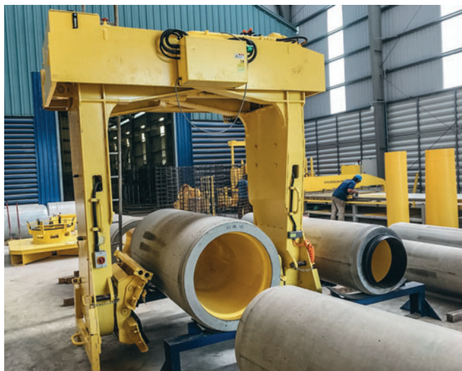
Phnom Penh Precast utilise actuellement la technologie des tuyaux Perfect dans les diamètres nominaux jusqu'au 700.

à venir. Il s'en est suivi une phase de conseil aussi courte qu'intensive, au cours de laquelle la gamme de produits et le concept de fabrication le plus adapté ont été choisis de façon à ce qu'au printemps 2019, à nouveau lors de la Bauma à Munich, la décision d'investissement puisse être finalisée. Le plus grand salon au monde du secteur de la construction a également été l'occasion de montrer aux propriétaires et représentants de Phnom Penh Precast que les tuyaux Perfect leur permettraient de compter parmi les leaders de l'innovation au niveau mondial.