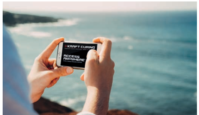
La interfaz Access Anywhere permite conectarse a la instalación de curado de hormigón con medios de comunicación modernos.

El sistema se ha desarrollado principalmente para jefes de producción responsables del funcionamiento correcto del sistema que deben garantizar una producción impecable al día siguiente. Access Anywhere también ayuda al control de calidad. Los datos allí guardados ayudan a los empleados a archivar y evaluar los procesos, con el fin de atender los crecientes requisitos de los clientes y cumplir las normas pertinentes.