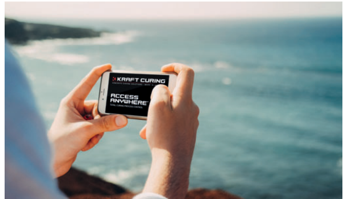
Die Schnittstelle Access Anywhere ermöglicht die Verbindung zur Betonhärtungsanlage mit zeitgemäßen Kommunikationsmitteln von jedem Ort.

Das System wurde vorrangig für Produktionsleiter entwickelt, die für den ordnungsgemäßen Betrieb des Systems verantwortlich sind und eine reibungslose Produktion am Folgetag gewährleisten müssen. Access Anywhere unterstützt ebenfalls bei der Qualitätskontrolle. Die dort hinterlegten Daten helfen den Mitarbeitern bei der Archivierung und Auswertung, um den steigenden Anforderungen von Kunden sowie staatlicher oder nationaler Vorschriften stets gerecht zu werden.